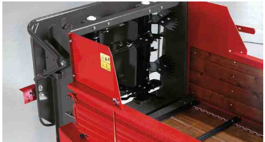
Rastepač sa zadnjom zaštitom i parom okomitih valjaka s pomičnim segmentima osigurava ravnomjerno i fino rasipanje. Rastepač je moguće brzo ukloniti i priključak koristiti kao prikolicu.

Nagnuti tereni zahtjevaju poseban razbacivač stajnjaka – a takav je ORION 35 ALP .