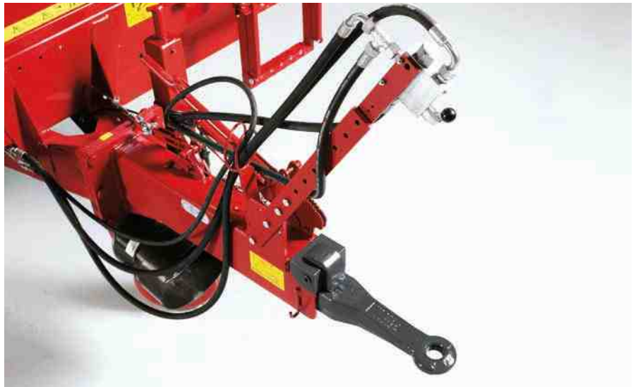
Vožnja s natovarenim razbacivačem je sigurnija uz naletnu kočnicu.

ORION 60 je izvrstan za korisnike koji traže jednostavan i pouzdan stroj za odlično razbacivanje.