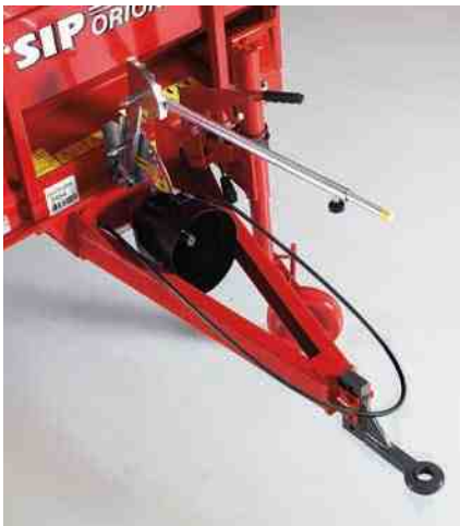
Vučeni priključak je vijcima pričvršćen na šasiju te ga je moguće podesiti za gornji ili donji priključak na traktor.