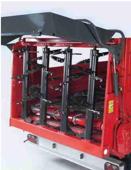
Jednakomjerno razbacivanje do širine 10 m omogućava rastepač s četiri okomita valjka.