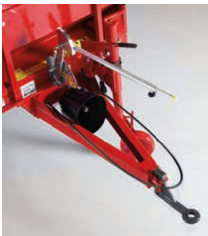
Vučeni priključak je vijcima pričvršćen na šasiju te ga je moguće podesiti za gornji ili donji priključak na traktor.