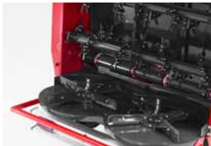
Transporter s hidrauličnim pogonom. Lančani transporter sastoji od 4 lanca 11 x 31 mm od visokotopnog kvalitetnog čelika. Široki rastepač omogućava rastros do širine 24 m.