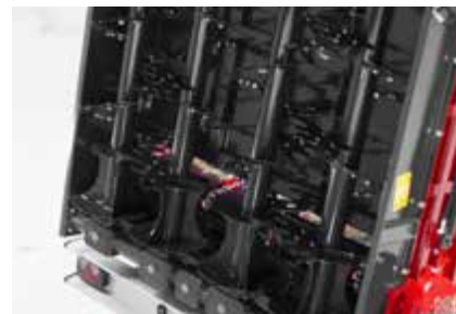
Rastepač s četiri okomita valjka sa zamjenjivim segmentima od kvalitetnog visokotopnog materijala.