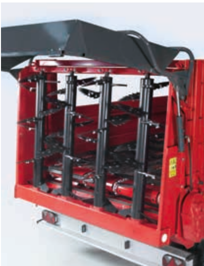
Jednakomjerno razbacivanje do širine 10 m omogućava rastepač s četiri okomita valjka.