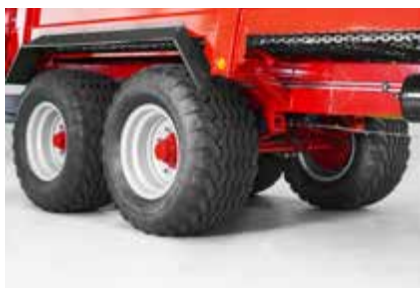
Dvoosovinsko podvozje razbacivača s lisnatim oprugama i širokim kolotragom omogućava brzine do 40 km/h.