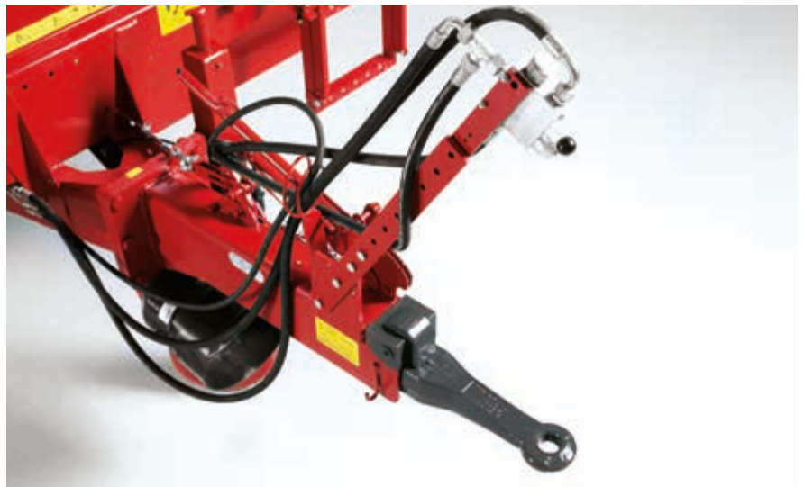
Vožnja s natovarenim razbacivačem je sigurnija uz naletnu kočnicu.

ORION 60 je izvrstan za korisnike koji traže jednostavan i pouzdan stroj za odlično razbacivanje.