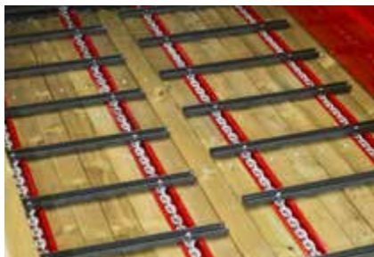
Transporter s hidrauličnim pogonom sa 4 lanca 13 x 36 od čelika visoke kvalitete.