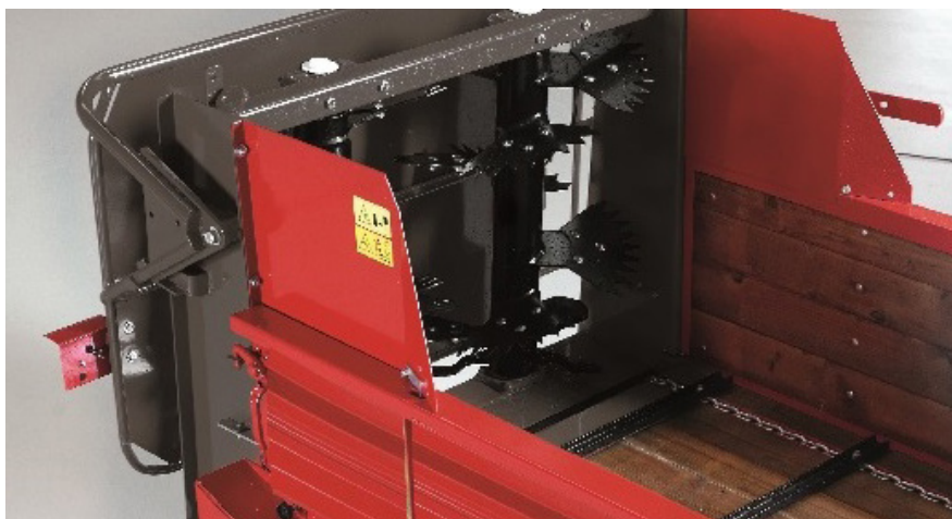
Rastepač (sa zadnjom zaštitom - dodatna oprema) i parom okomitih valjaka s pomičnim segmentima osigurava ravnomjerno i fino rasipanje.

Nagnuti tereni zahtjevaju poseban razbacivač stajnjaka – a takav je ORION 35 ALP .