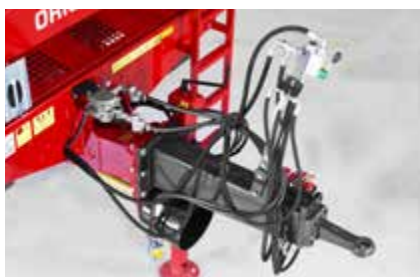
Jednostavno upravljanje strojem komandama dostupnim iz sjedala traktora.

Ugrađen je i napredan hidraulični sistem s hidrauličnim zasunom ispred valjaka te zaštitom valjaka - oboje je dio serijske opreme.