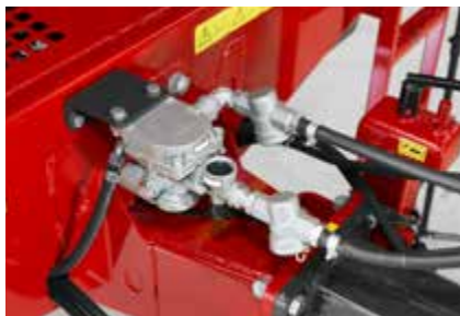
Najsigurnije kočenje kod punog rastepača omogućava dvokružni zračni sistem s ALB.