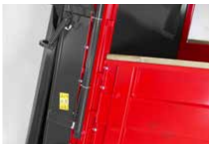
Rastepač možemo jednostavno odvojiti od stroja i koristiti prikolicu za prijevoz različitih tereta.

ORION 140 je veći profesionalni razbacivač stajnjaka s varenom šasijom, robusnim okvirom i ukupnom masom 14 tona te iznimno jednostavan za upravljanje. Pomik transportera napred-nazad i druge komande dostupne su iz kabine traktora dok podporna noga omogućava brzo i sigurno podizanje rastepača.