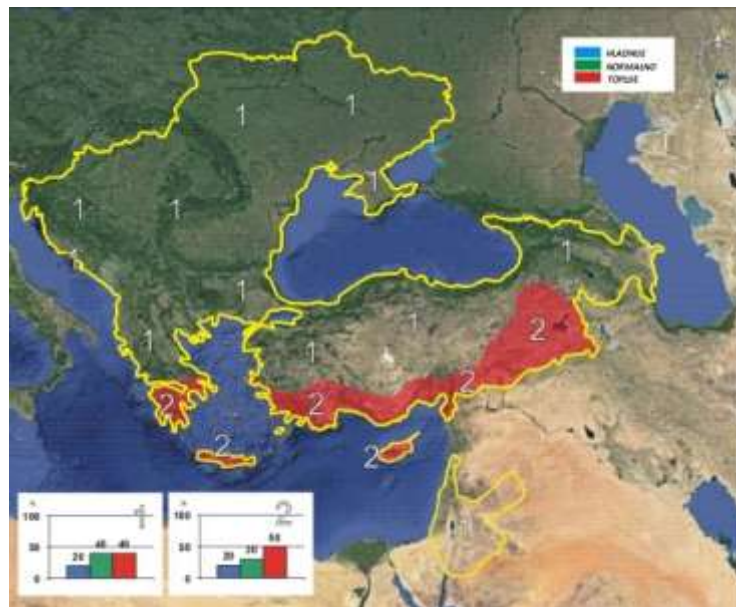
Map 1 - Prostorna raspodjela prognoziranih anomalija temperature zraka za period decembar 2022. – februar 2023.