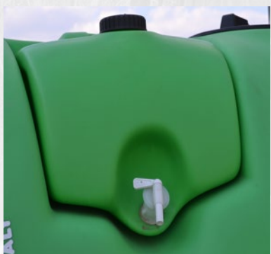
Rezervoar za pranje ruku Hand washing tank