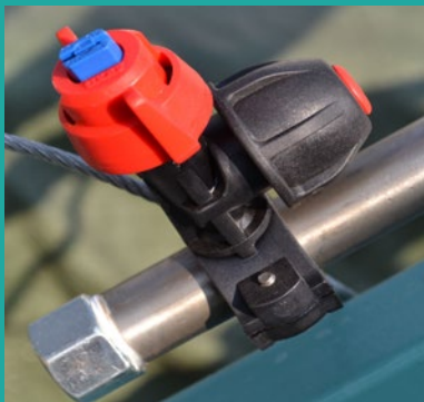
Rasprskiyač sa sistemom protiv kapljenja Nozzle holder complete with nozzle and anti drop