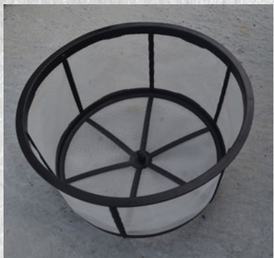
Sitasti filter Stainer filter