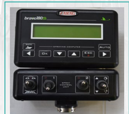
Kompjuter Bravo180 Computer Bravo180