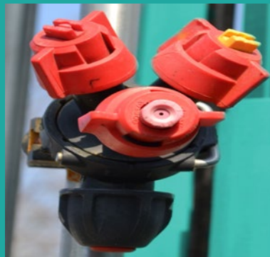
Tripleks dizne Trijet nozzles