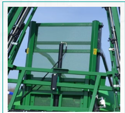
Hidraulično podizanje grana Hydraulic lifting booms