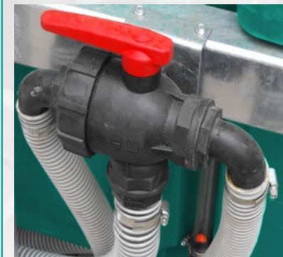
Filter za samopunjenje Intake filter predisposed for self-filling