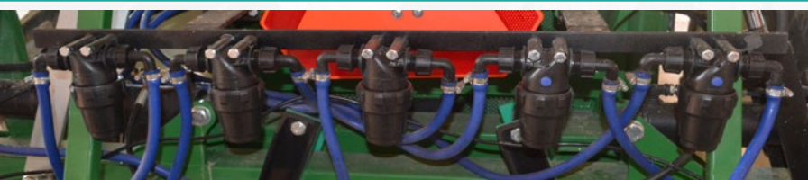
Linijski filteri Line filters