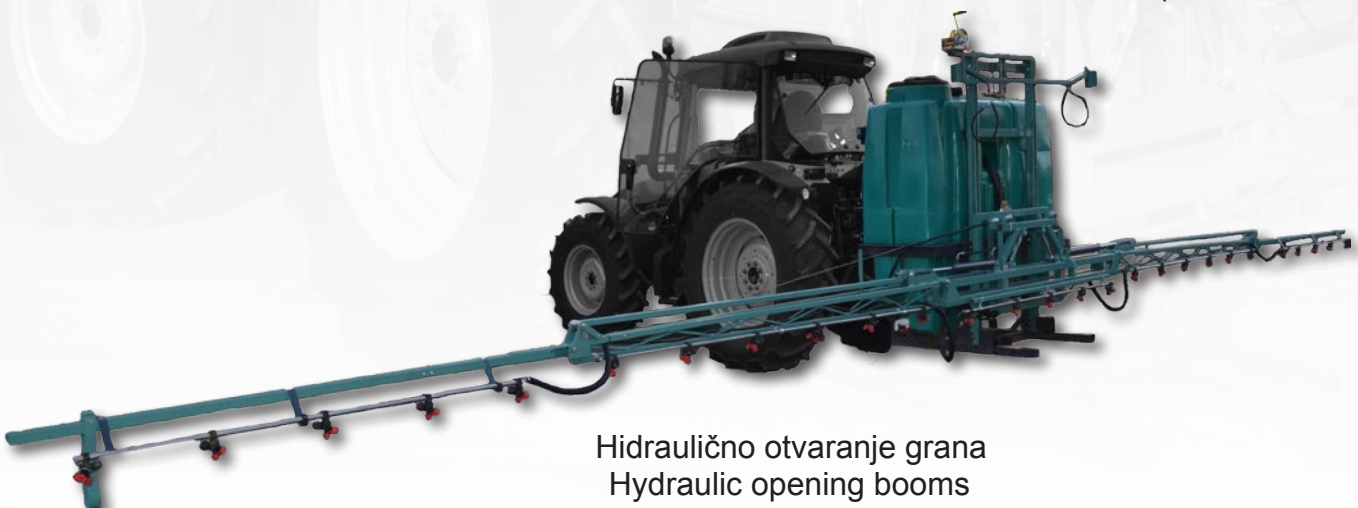
Hidraulično otvaranje grana Hydraulic opening booms