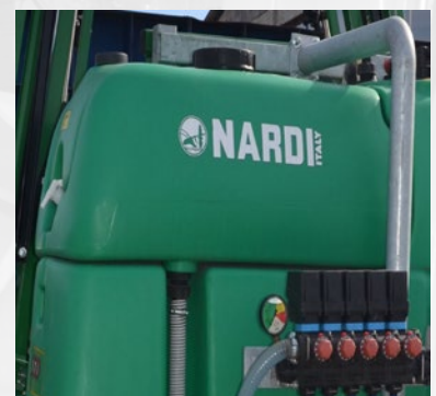
Rezervoar za pranje sistema Circuit washing tank