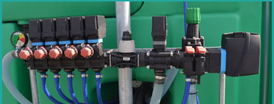
Elektronska komandna grupa Electronic command unit