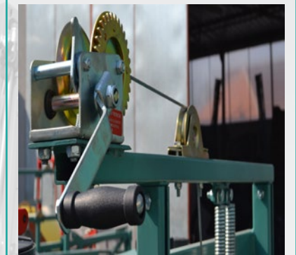
Čekrk sistem za podizanje grana Winch lifting the booms