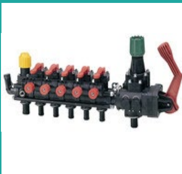
Komandna grupa sa 5 sekcija Proportional distributor with 5 ways

Nardi mounted sprayers are highly specialized implements intended for agricultural use. They are special designed in order to provide the very best chemical protection in corp production, thanks to a series of technical innovation. Nardi produce the implements with a great care of enviroment and users of products and in this purpose have large number of different mounted sprayers with tank capacities ranging from 800 to 1200L, with best quality components, which, with their wide range of use, can meet the expectations of even the most demanding users.