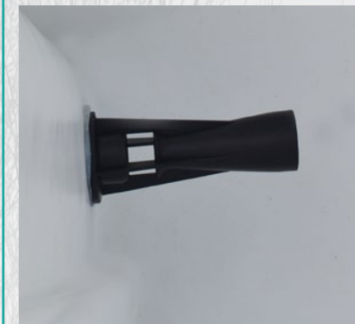
Hidromešač Hydraulic agitator