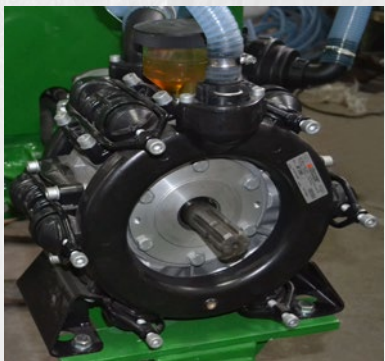
Membranska pumpa Diaphragm pump