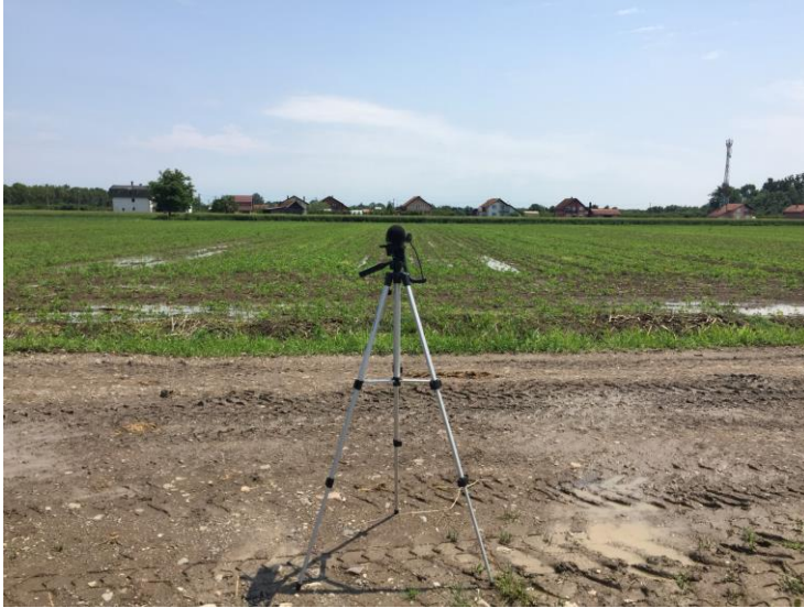
Mjerno mjesto 1