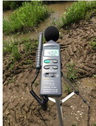
Mjerno mjesto 4