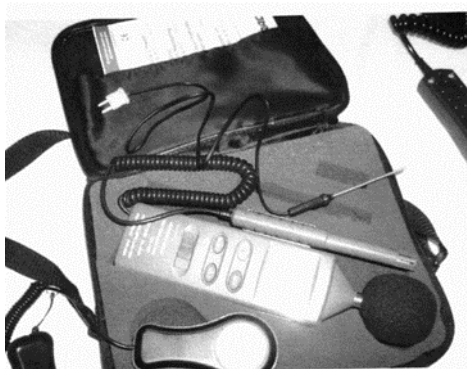
Instrument bukomjer proizvođača "Volkraft" tip 33-2050

Mjerenje intenziteta ukupnog 15-minutnog ekvivalentnog nivoa buke, izvršeno je na definisanim mjernim mjestima, a normiranje izvršeno u skladu sa Pravilnikom o dozvoljenim granicama intenziteta zvuka i šuma („Sl. list SR BiH“, broj 46/89) i ISO preporukama. Nivo buke mjereno je instrumentom bukomjer proizvođača "Volkraft" tip 33-2050, korištenjem filtra "A".