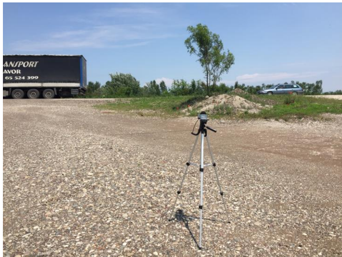
Mjerno mjesto 2