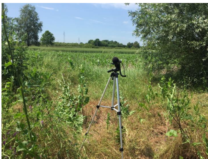
Mjerno mjesto 3