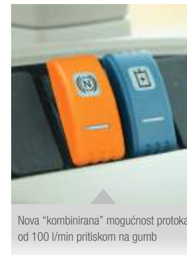
Nova "kombinirana" mogućnost protoka od 100 l/min pritiskom na gumb

Treći klipni razvodni ventil dostupan je po izboru za napajanje zahtjevnijeg dodatnog priključka.