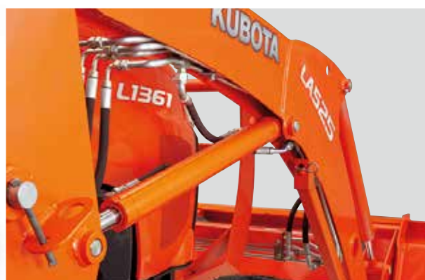
Zaštićena hidraulična crijeva