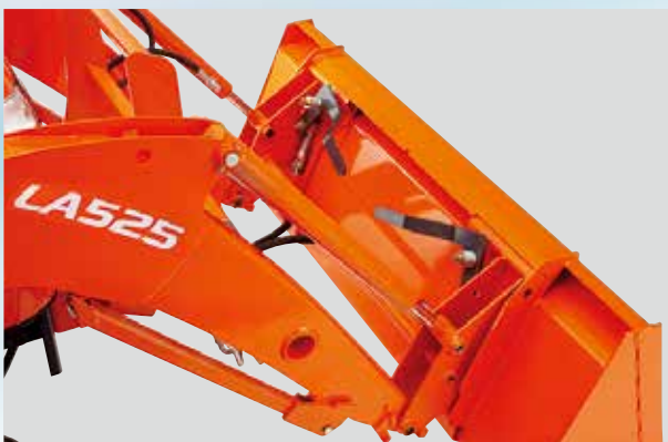
Okvir sa brzim kopčanjem za priključke utovarivača

Utovarivač ostavite spojen na traktor samo ako ga koristite. Zahvaljujući integriranim nosačima za parkiranje utovarivača i inovativnom sistemu brzog spajanja sa hidrauličnim sistemom, spajanje i otpajanje s traktorom obavlja se u minutama. Euro priključak je također jednostavan za korištenje.