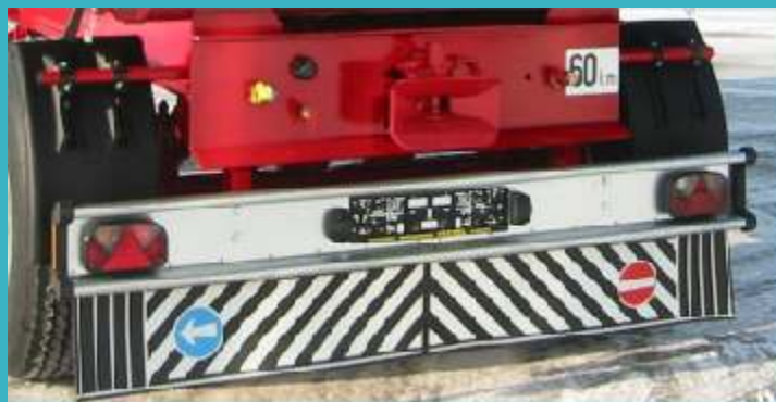
Serijski od 18 t 40 km/h pocinčana odbojna greda