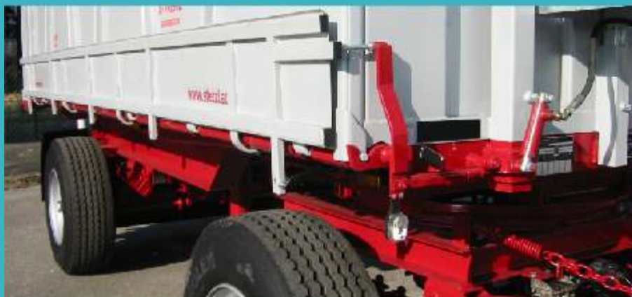
Dodatna hidraulična stranica za izmicanje sa automatskim centralnim otvaranjem