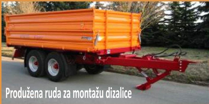
Produžena ruda za montažu dizalice