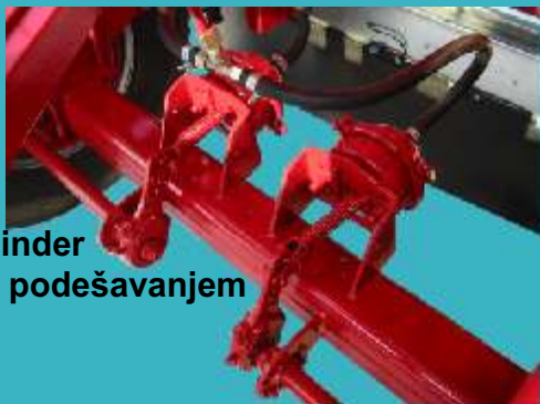
Membranski cilindar sa mehaničkim podešavanjem