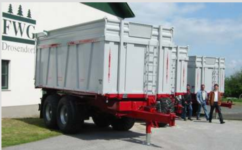
Iznimno jaki žarniri debljine 15 mm