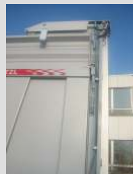
Iznimno čvrsti kutni nosači