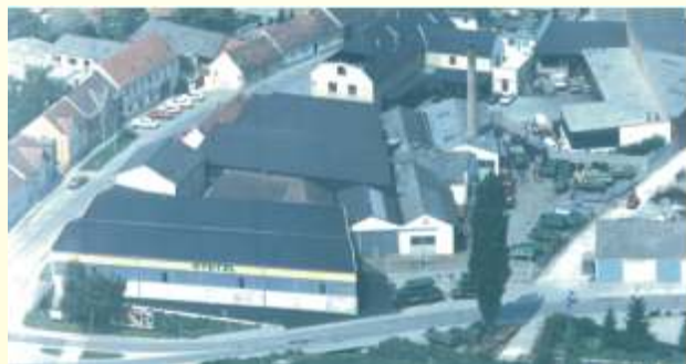
Proizvodni pogon I

Putem ugredenih kvalitetnih komponenti, vrhunske izrade u proizvodnji i dobro razvijene prodajno-servisne mreže garantiramo našim kupcima jednaku kvalitetu svih STETZL proizvoda.