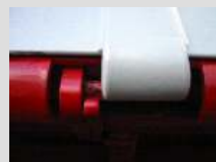
X-treme 15 mm