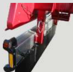
Izmjenjiva odbojna greda

1500 mm visoke čelične stranice trostranog Mulden kiperu izrađene iz hladno prešanog C profila s asimetričnim zavarenim V profilima daju iznimnu robusnost prikolici.