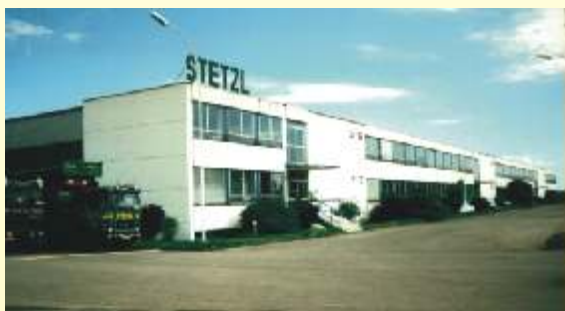
Proizvodni pogon II 36.000 m2 proizvodne površine

Tel.: +43 (0) 2532/2257-0; Fax.: +43 (0) 2532/2253