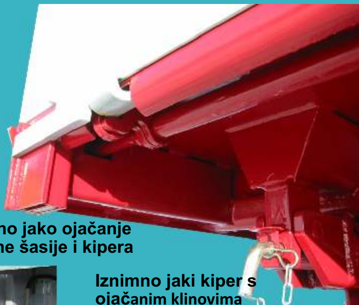
Iznimno jako ojačanje teretne šasije i kipera