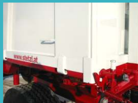
Dodatni ojačani žarniri kod centralnog otvaranja