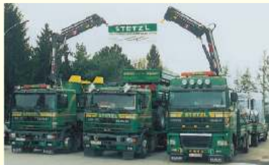
Naš vozni park

Naša moderna tvornica prikolica, smještena u A-2225 Zisterdorf/ Niederösterreich garancija je austrijske kvalitetne izrade.