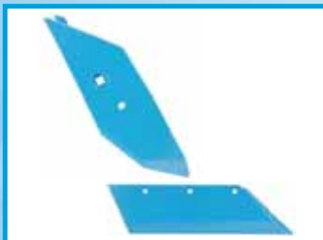
originalni rezervni dijelovi