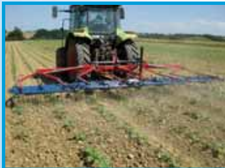
Hatzenbichler original štrikli i kultivatori