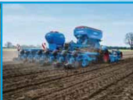
sijačice za okopavine