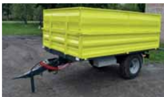
TSP-3 za male traktore sa duplim stranicama