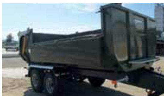
Prikolica TSP-3 sa zadnjim vratima