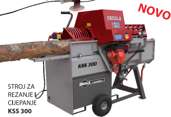
STROJ ZA REZANJE I CIJEPANJE KSS 300

Od 1970, rješavanje problema i ljudska suradnja su glavna filozofija iza marke BGU-Maschinen. Iz te ideje nastao je širok spektar strojeva koje odlikuje jednostavnost, savršena funkcionalnost, visoka kvaliteta i nenadmašna vrijednost za novac.