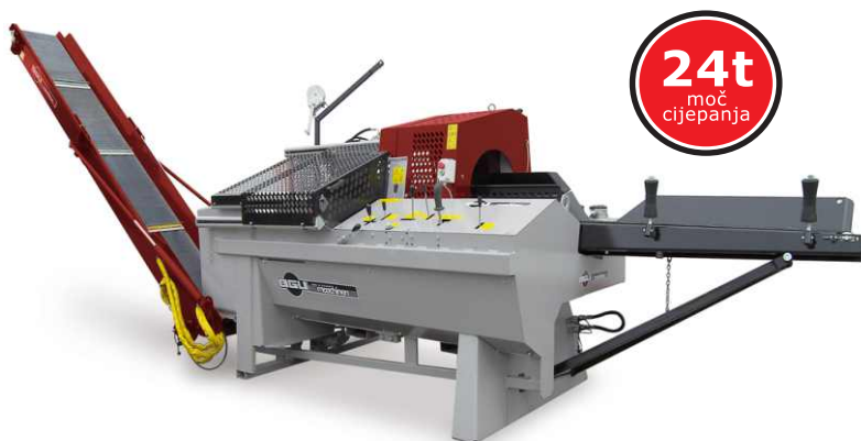
STROJ ZA REZANJE I CIJEPANJE KSA 450 EZ

Polazeći od stolne pile, u razdoblju od 25 godina djelovanja, asortiman tvrtke BGU-Maschinen ja narastao na više od 100 različitih strojeva i alata. Zahvaljujući njihovom know-how istraživanju i razvoju prodaja njihovih vrhunskih strojeva se izvodi pod sloganom "uvjeravati izvedeći".