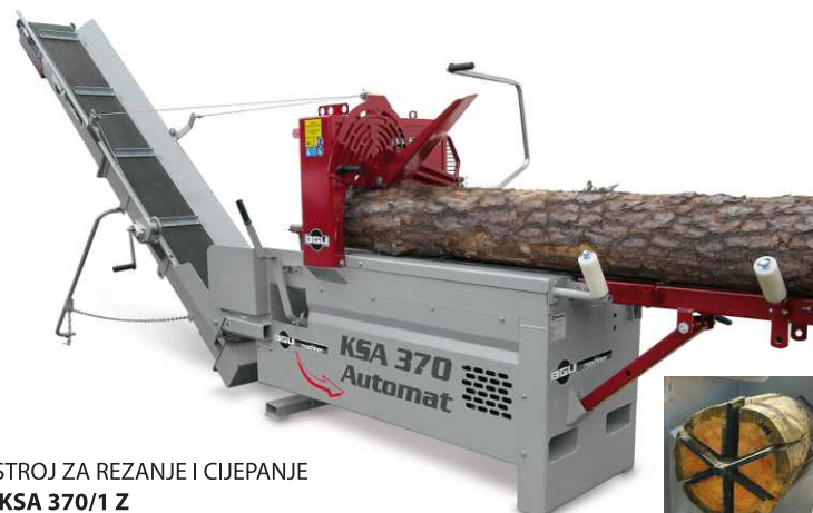
STROJ ZA REZANJE I CIJEPANJE KSA 370/1 Z