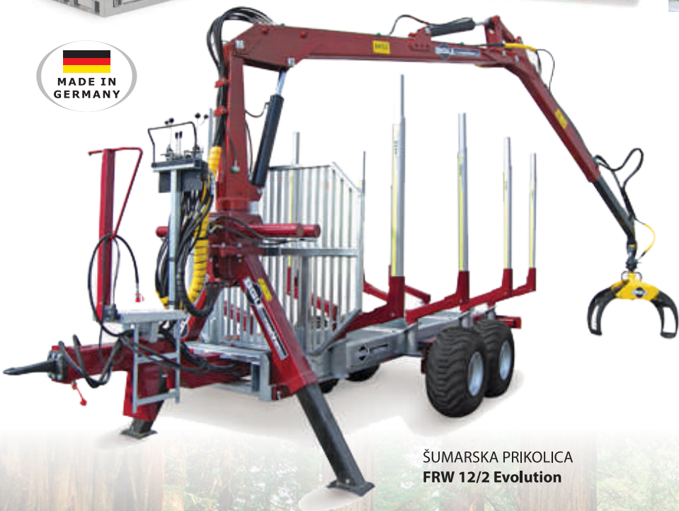
ŠUMARSKA PRIKOLICA FRW 12/2 Evolution