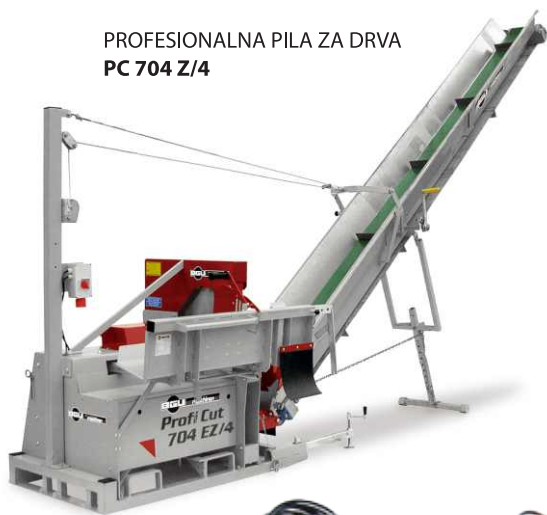
PROFESIONALNA PILA ZA DRVA PC 704 Z/4