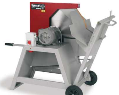
KRUŽNA PILA SPESSART WOODY 701 CR