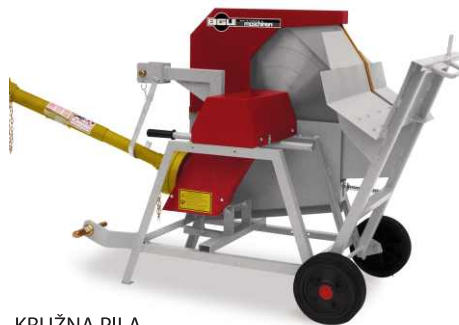
KRUŽNA PILA WK 700 Z Classic (CR)