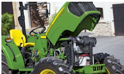
Širok otvor: lagan pristup servisnim točkama motora