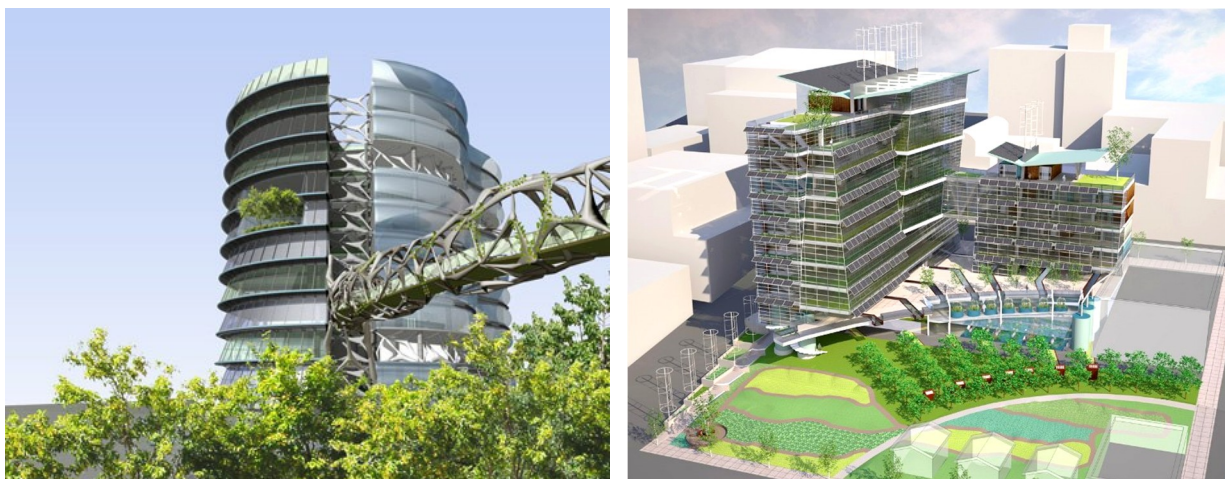
Slika 3. Vertikalne farme budućnosti (Dickson Despommier :The Vertical Farm - Feeding the World in the 21st Century, 2010.)

Gledano iz današnje perspektive proizvodnja i konzumacija „pametne hrane“, prilagođene metabolizmu i potrebama svakog pojedinca, čini se još daleko. Međutim, očekuje se nakon 2030. god. primjena „ultra visoke tehnologije“ u proizvodnji hrane, posebice u zaštićenim prostorima koji će postupno promijeniti design u vertikalne, višeetažne i energetske samoobnovljive proizvodne prostore s vrlo preciznom regulacijom agroekoloških uvjeta prilagođenih različitim vrstama uzgoja (Slika 3.).