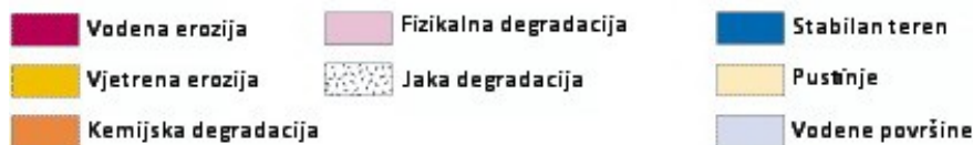
Slika 1. Degradacija tla na globalnoj razini