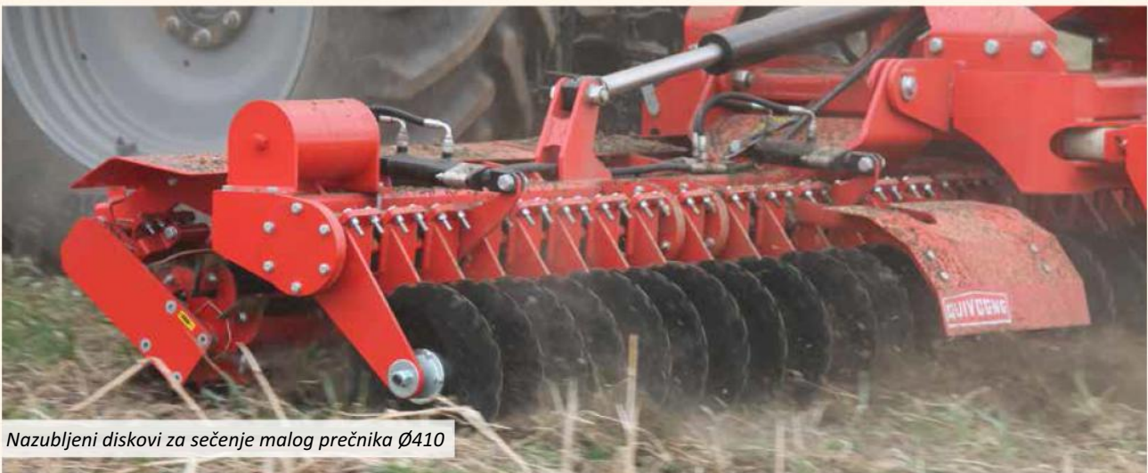
Nazubljeni diskovi za sečenje malog prečnika Ø410