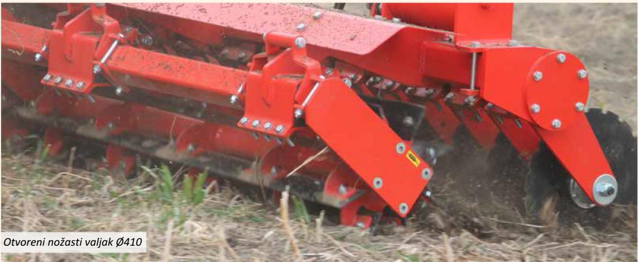
Otvoreni nožasti valjak Ø410