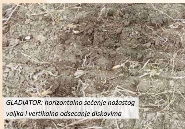
GLADIATOR: horizontalno sečenje nožastog valjka i vertikalno odsecanje diskovima