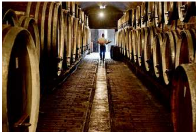
Les caves d'Ilok, creusées dans les souterrains du château.