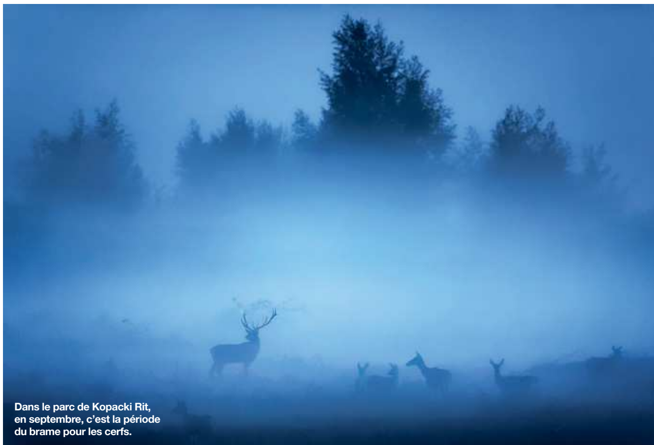
Dans le parc de Kopacki Rit, en septembre, c'est la période du brame pour les cerfs.