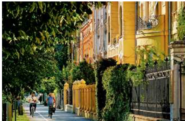
Ci-dessus, les immeubles Sécession de la ville haute, à Osijek.