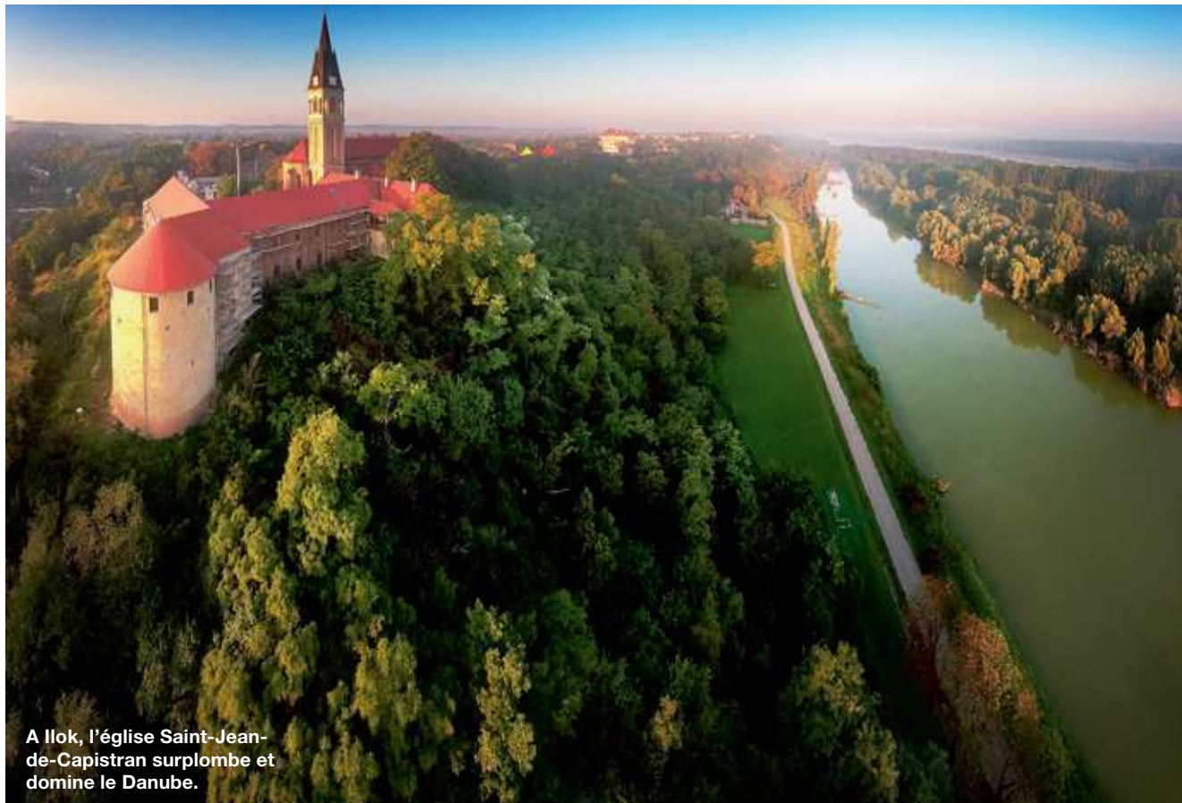
A Ilok, l'église Saint-Jean-de-Capistran surplombe et domine le Danube.