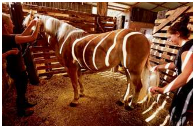
Les écuries de Dakovo accueillent 240 chevaux lipizzans.