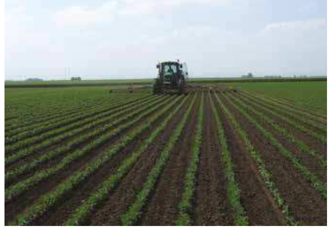
Нега усева – међуредна култивација