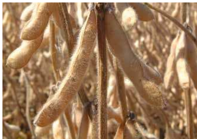
Биљке соје у пуној зрелости