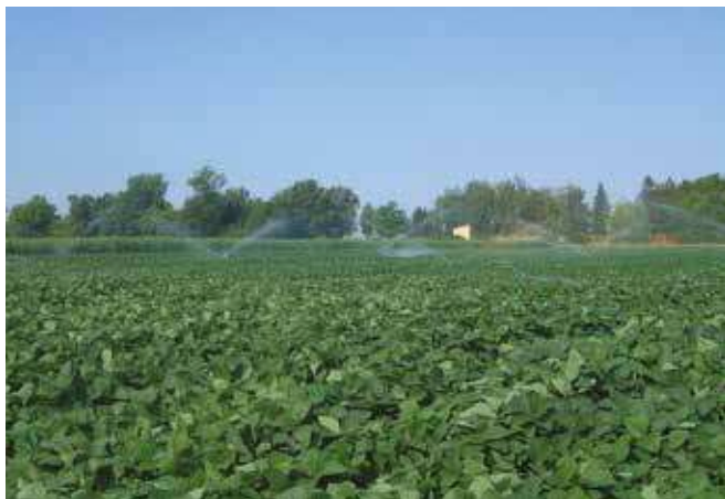
Наводњавање соје