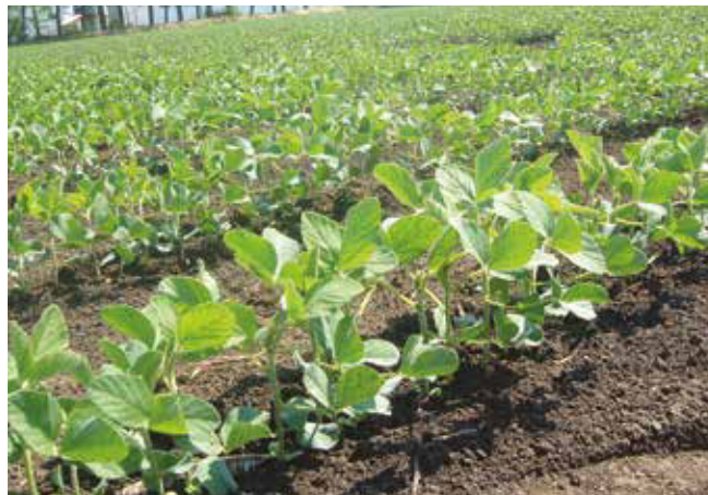
Биљке соје у вегетативној фази

Земљиште – Соја тражи плодно, растресито, добро аерисано земљиште, садубоки мораничним слојем, неутралне рН реакције. Као и свака легуминоза, соја ступа у симбиотски однос са земљишним азотофиксирajuћим бактеријама ( Rhizobium и Bradyrhizobium ). Ове бактерије живе у квржицама корена соје. Оне узимају азот из атмосфере и претварају га у облик погодан за исхрану биљке. За развој ових бактерија потребан је ваздух, због чега је добро аерисано земљиште важан предуслов за успешну производњу соје. Такође је за активност азотофиксирajuћих бактерија потребно да земљиште не буде ни киселе, ни алкалне реакције. Ако су азотофиксирajuће бактерије активне, оне снабдевају биљку соје потребним азотом, а то смањује потребу за ђубрењем. Да ли су бактерије активне, може се утврдити пресецањем квржице – уколико је боја ружичаста или, још боље, црвена, то значи да су бактерије активне. Уколико се соја добро обезбеди водом и хранљивим материјама, онда није посебно захтевна према типовима и условима земљишта.