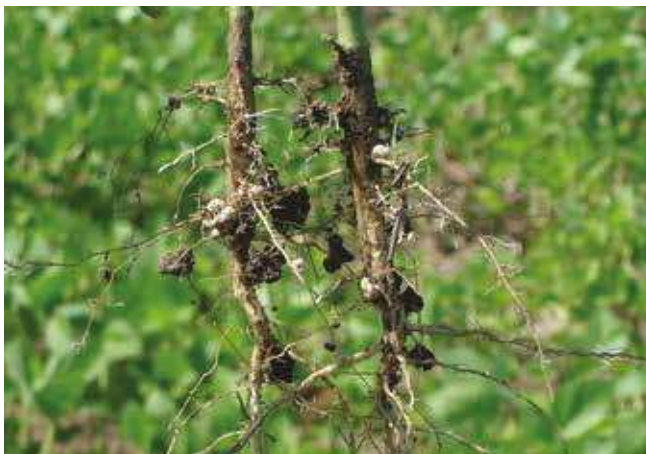
Квржице на корену соје

Земљиште – Соја тражи плодно, растресито, добро аерисано земљиште, садубоки мораничним слојем, неутралне рН реакције. Као и свака легуминоза, соја ступа у симбиотски однос са земљишним азотофиксирajuћим бактеријама ( Rhizobium и Bradyrhizobium ). Ове бактерије живе у квржицама корена соје. Оне узимају азот из атмосфере и претварају га у облик погодан за исхрану биљке. За развој ових бактерија потребан је ваздух, због чега је добро аерисано земљиште важан предуслов за успешну производњу соје. Такође је за активност азотофиксирajuћих бактерија потребно да земљиште не буде ни киселе, ни алкалне реакције. Ако су азотофиксирajuће бактерије активне, оне снабдевају биљку соје потребним азотом, а то смањује потребу за ђубрењем. Да ли су бактерије активне, може се утврдити пресецањем квржице – уколико је боја ружичаста или, још боље, црвена, то значи да су бактерије активне. Уколико се соја добро обезбеди водом и хранљивим материјама, онда није посебно захтевна према типовима и условима земљишта.