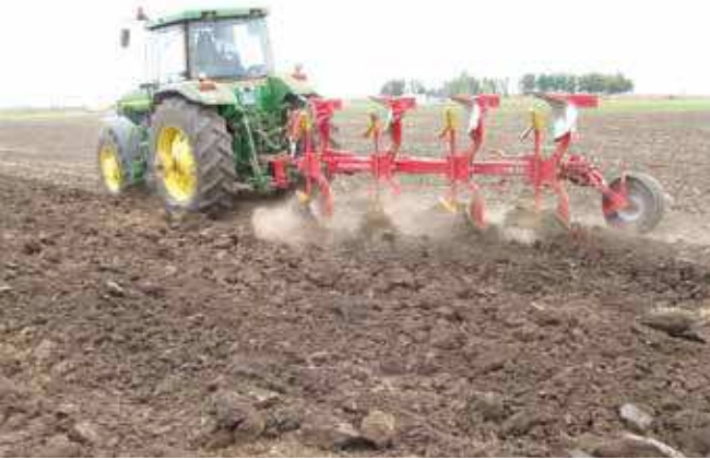
Основна обрада земљишта за соју