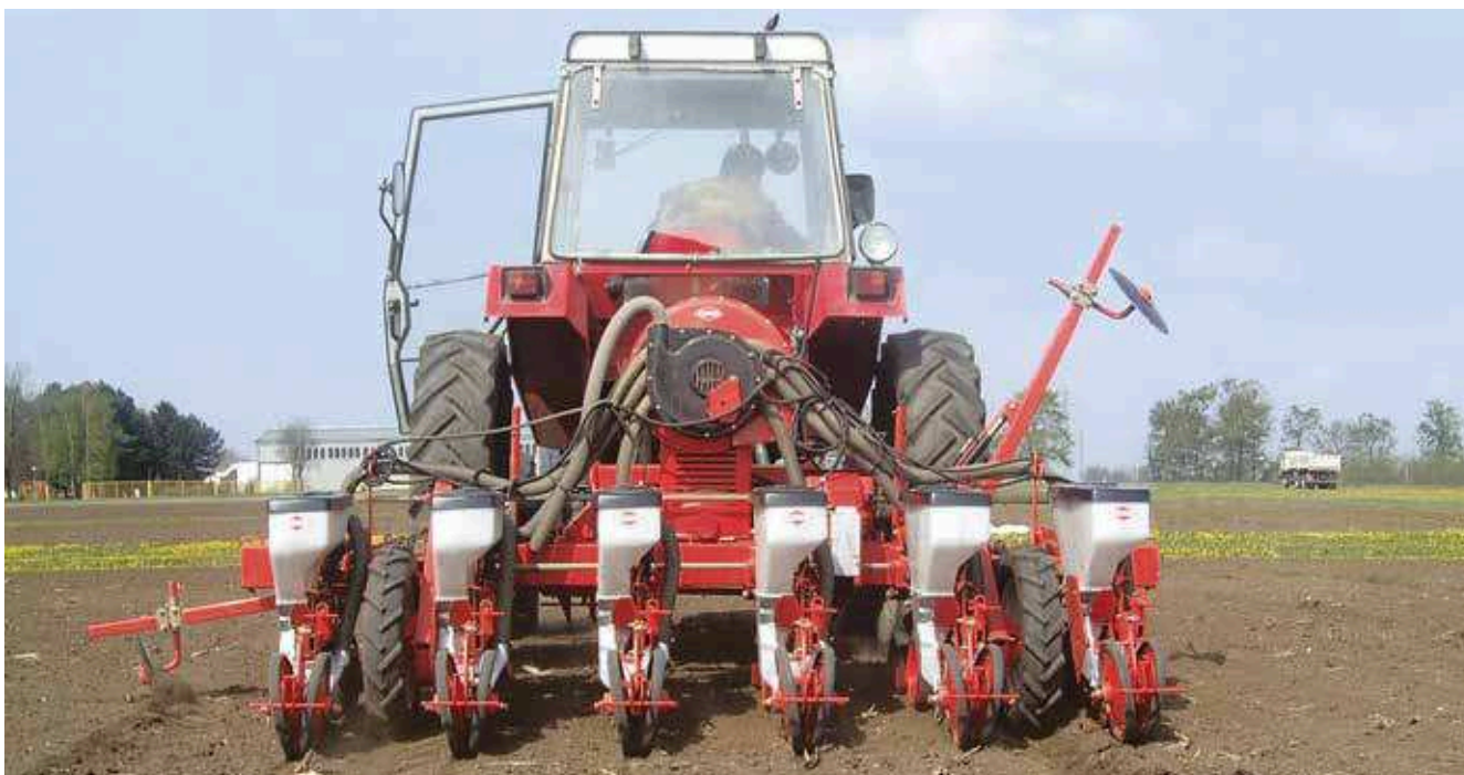
Слика за соју