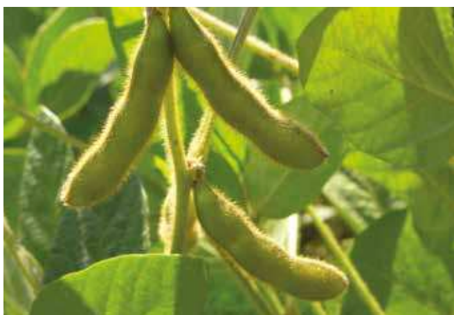
Зелене махуне соје – наливање зрна