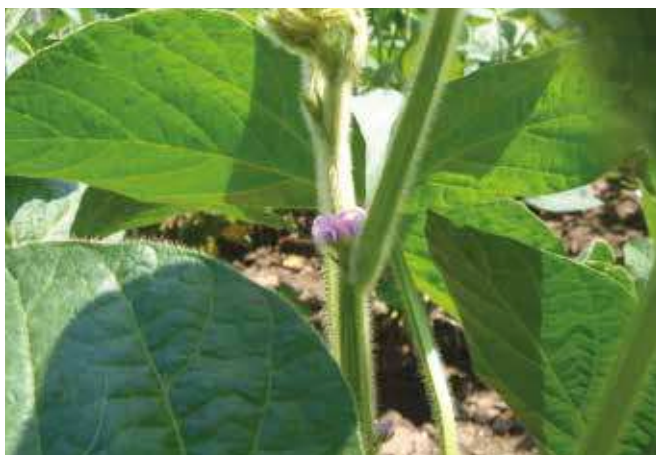
Цветање соје