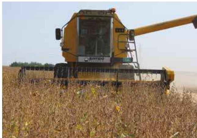
Жетва соје