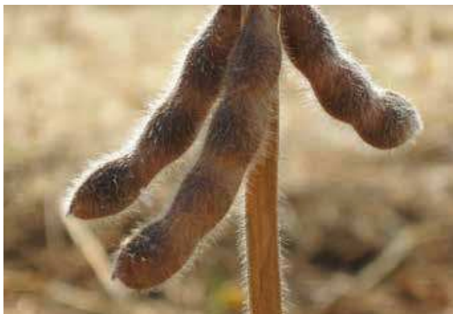
Зреле махуне соје

тада нема довољно воде, соје ће слабије формирати махуне и имати мањи број зрна. У периоду наливања махуна / зрна, соја има други максимум у потребама за водом. Од количине воде која се налази на располагању биљци у овој фази највише зависи принос. У нашим условима то је крај јула и почетак августа. После наливања зрна, потребе соје за водом нагло опадају, јер биљка отпушта влагу, одбацује листове и спремна је за жетву.