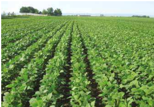
Соја - зелени усев