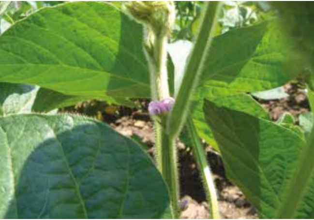
Цветанње соје