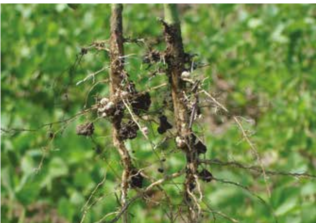
Квржице на корену соје