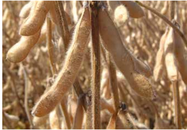
Биљке соје у пуној зрелости