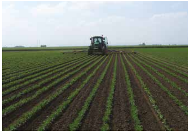
Нега усева – међуредна култивација