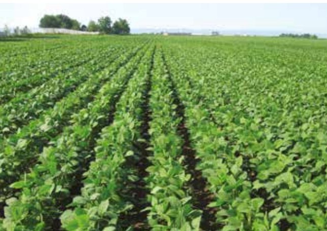
Соја - зелени усев