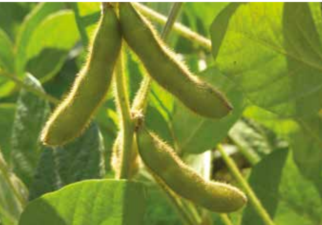
Зеле махуне соје – наливање зрна