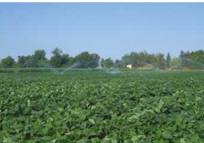
Наводњавање соје