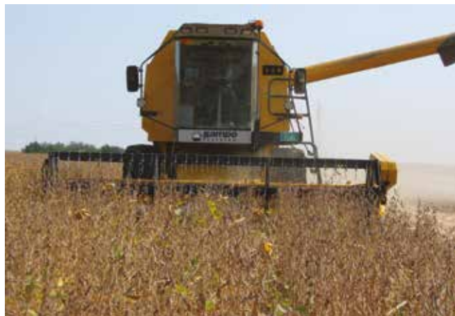
Жетва соје