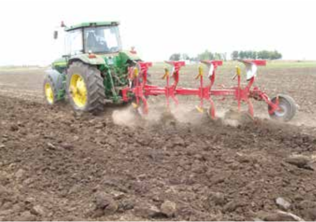
Основна обрада земљишта за соју