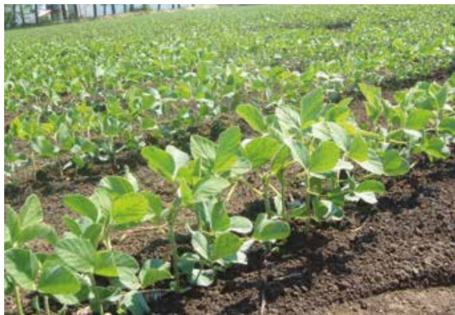
Биљке соје у вегетативној фази

Земљиште – Соја тражи плодно, растресито, добро аерисано земљиште, садубокимораничнимслојем, неутралне pH реакције. Као и свака легуминоза, соја ступа у симбиотски однос са земљишним азотофиксирajuћим бактеријама ( Rhizobium и Bradyrhizobium ). Ове бактерије живе у квржицама корена соје. Оне узимају азот из атмосфере и претварају га у облик погодан за исхрану биљке. За развој ових бактерија потребан је ваздух, због чега је добро аерисано земљиште важан предуслов за успешну производњу соје. Такође је за активност азотофиксирajuћих бактерија потребно да земљиште не буде ни киселе, ни алкалне реакције. Ако су азотофиксирajuће бактерије активне, оне снабдевају биљку соје потребним азотом, а то смањује потребу за ђубрењем. Да ли су бактерије активне, може се утврдити пресецањем квржице – уколико је боја ружичаста или, још боље, црвена, то значи да су бактерије активне. Уколико се соја добро обезбеди водом и хранљивим материјама, онда није посебно захтевна према типовима и условима земљишта.