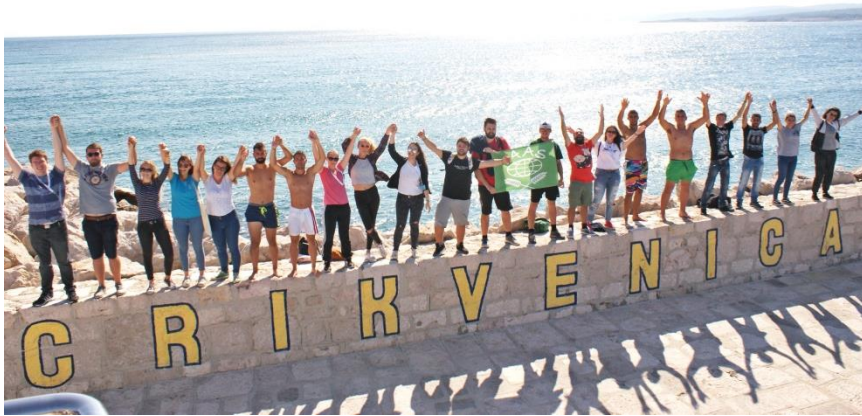
World Congress (Svjetski kongres): "Croatia: A Tale of Land and Water" 2018.