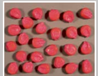
VP - veliko plosnato

Bogat čovjek je onaj koji zna izabrati sjeme.