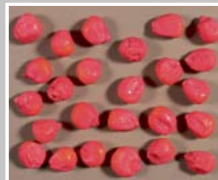
VO - veliko okruglo