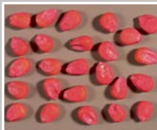
SP - srednje plosnato