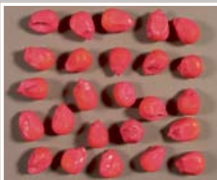
SO - srednje okruglo

SJEME KALIBRIRANO U 4 FRAKCIJE - VEĆA BIOLOŠKA VRIJEDNOST: