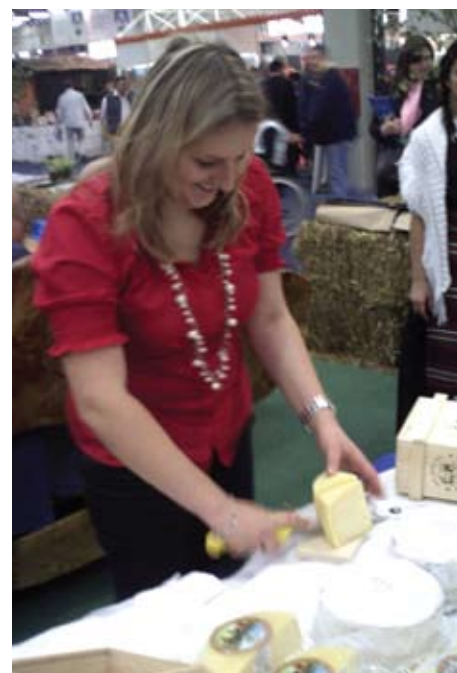
Sirevi su najčešće spominjani kao autohtoni proizvod. Na slici sir iz Krasnog

Ivanišević smatra da je zaštita proizvoda, iako vjerojatno zamišljena kao zaštita potrošača, uglavnom marketinška kategorija koja proizvodi dodanu vrijednost. Dodaje i da brandiranje može pomoći proizvodnji hrvatskog kulinarškog identiteta, koji zasad ne postoji kao izvozna marka. 'S toliko razvijenim turizmom, bilo bi suludo ne iskoristiti ovu prednost, tim prije što je prošlo vrijeme sunca, mora i ćevapa - zahtjevniji gosti donose i više novaca, naravno pod uvjetom da im ponudimo nešto', tumači Ivanišević