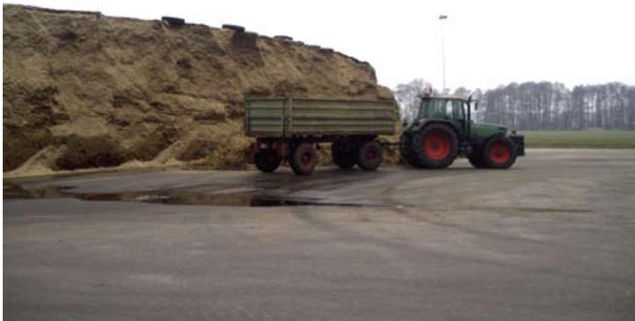
Silaža kukuruza za postrojenje Bioplina na farmi Urban u Njemačkoj