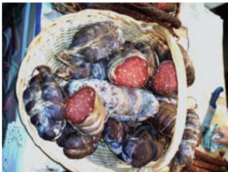
Slovinci proizvode i nekakav svoj kulen

američki predsjednik Bush. Iako Bogataj kasnije smiruje tenziju komentirajući da je 'zaštiti čvarke jednako paradoksalno kao i zaštititi svinjsku mast', dodaje i da je 'problem Hrvata činjenica da nemaju dovoljno zaštićenih proizvoda'.