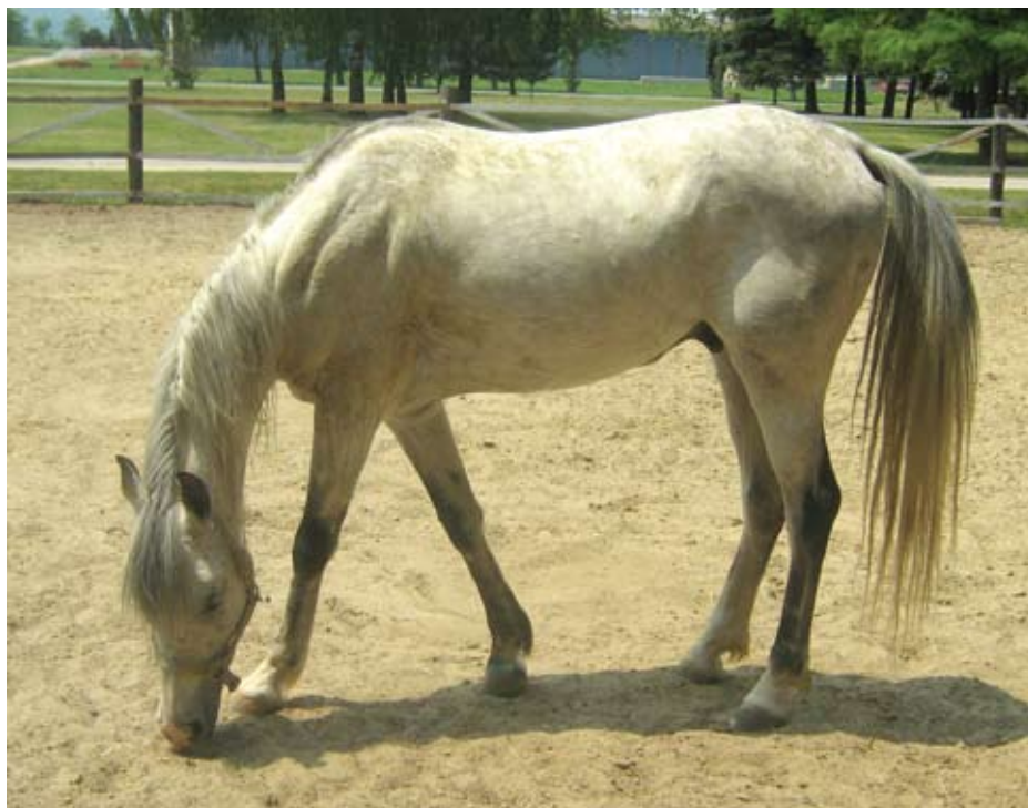
Uzgajivači konja u strahu zbog nekoliko bolesti koje se povremeno pojavljuju

Iznimno od prethodnog stava, kada iz opravdanih razloga nije moguće izvršiti procjenu štete na tekućoj poljoprivrednoj proizvodnji po vlasnicima odnosno korisnicima (sukladno prethodnom stavu), moguće je uz suglasnost županij-