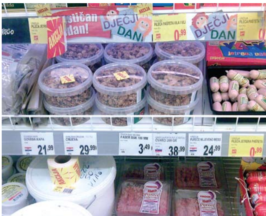
Na fotografiji snimljenoj u osječkoj Billi vidljivi su slovenski čvarci po cijeni od 38,99 kuna za 260 grama. Što znači da je kilogram oko 150 kuna.

Mogućnost da države zapadnog Balkana, dok se približavaju Europskoj uniji, zaštite svoje proizvode koji se proizvode i u Sloveniji zabrinjavaju neke slovenske proizvođače. Boje se da ih više ne bi mogli prodavati pod dosadašnjim nazivima, kako se to prije dvije godine dogodilo koparskoj vinariji koja je zbog pritiska iz Mađarske morala prestati puniti svoje bijelo vino "Tokaj".