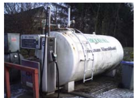
Biodizel pumpna stanica u krugu tvornice Amazone u Njemačkoj

Monsanto trenutno pod složenim kodnim imenima razvija novu generaciju sušo-otporne kuruze, što je direktni odgovor na kuknjavu domaćih seljaka frustriranih sve većom nemilosrdnošću majčice prirode. Statistike već jasno pokazuju da su suše sve duže i količina godišnjih padalina konstantno se smanjuje. No, ne razvija se ovo rješenje samo za ratare lowe i Nebraske. Pravi bi bum sušo-otporni proizvod (masovna prodaja) mogao postići u Indiji, zemlji s 1,1 milijardi stanovnika. Bivša britanska kolonija ostala je uglavnom na agro-tehnološkom razvoju kakav su ostavili Britanci. Manji pomaci su postignuti tijekom 'Zelene revolucije' 60-ih kada su uvedene nove vrste sjemena, umjetna gnojiva, irigacijai slično, ali to se nije proširilo na cijelu zemlju i prebrzo je napredak utihnuo.