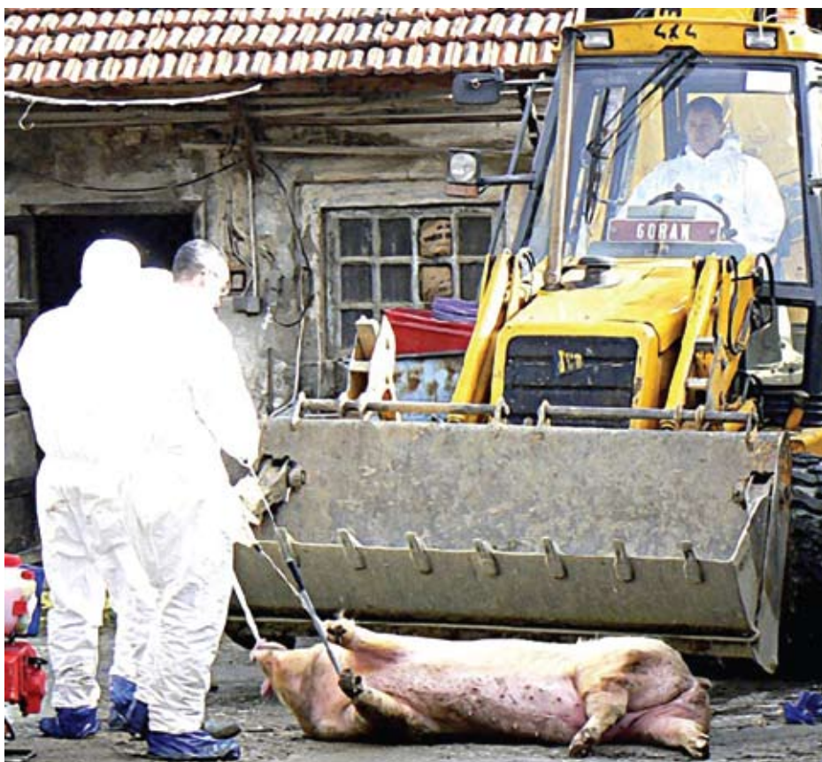
Posljednjih godina u stočarstvu najviše je problema bilo s pojavom svinjske kuge

na pomoć se dodjeljuje iz proračunskih sredstava jedinica lokalne samouprave i uprave, ako su osigurana.