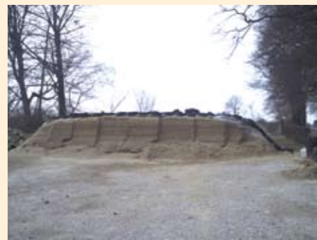
Silaža cijele stabljike i klipa kukuruza za tov junadi