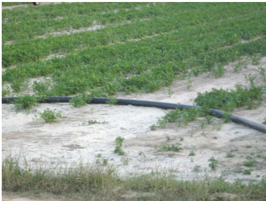
Poplave uslijed velikih oborina vrlo su česta elementarna nepogoda

Procjena štete od elementarne nepogode u stočarstvu obuhvaća štetu na govedima, svinjama, ovcima, kozama, konjima, magarcima, mulama, mazgama, peradi, pčelama, divljači i ribama. Procjenjuje se samo šteta na uništenim (uginulim) životinjama. Utvrđuje se broj uginule stoke po vrstama i kategorijama. Za svaku kategoriju stoke utvrđuje se prosječna jedinična težina žive vage i odgovarajuća tržišna cijena po kilogramu žive vage. Šteta je jednaka umnošku broja komada, prosječne jedinične težine i tržišne cijene iz prethodne godine po kilogramu žive vage. Pri procjeni štete u pčela, utvrđuje se ukupan broj uginulih društava, pa se primjenom odgovarajućih tržišnih cijena iz prethodne godine utvrđuje šteta. Pri procjeni šteta u ribarstvu procjenjuje se ukupna količina uginule (nestale) ribe po vrstama, te se primjenom odgovarajućih prosječnih tržišnih cijena iz prethodne godine izračuna iznos štete. Štete se za uništenu divljač obračunavaju tako, da se procijeni broj uništene divljači po vrstama pomnoži s prosječnim cijenama iz prethodne godine po kojima se naplaćivao odstrel pojedine vrste divljači. Cijene divljači objavljuje Državno povjerenstvo.