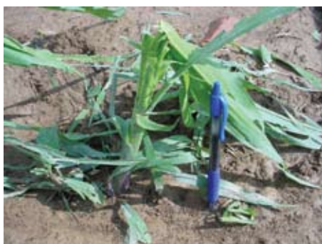
Najčešće u lipnju svake godine poljoprivrednici strahuju od redovitog naleta ledotuče

U slučaju djelomičnog oštećenja započete proizvodnje koja se uz dodatna ulaganja (dosijavanje, dodatna gnojidba, njega, zaštita i druge mjere) može popraviti odnosno dovesti u prvobitno stanje, iznos štete na toj proizvodnji jednak je vrijednosti dodatnog ulaganja. Štete se obračunavaju za svaku kulturu po vlasnicima odnosno korisnicima zasi-