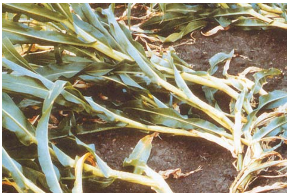
Epidemija i napad kukuruzne zlatice na svu sreću nije česta pojava, ali spada u kategoriju elementarnih nepogoda i problem je gdje god se pojavi

za proračun štete je prosječni trogodišnji prirod te kulture u županiji po jedinici mjere. Navedeni prirod treba pomnožiti s prosječnim tržišnim cijenama ostvarenim u prethodnoj godini u Republici Hrvatskoj i dobiveni iznos umanjiti za procijenjene nerealizirane troškove gnojidbe, zaštite, berbe, prijevoza, sušenja i