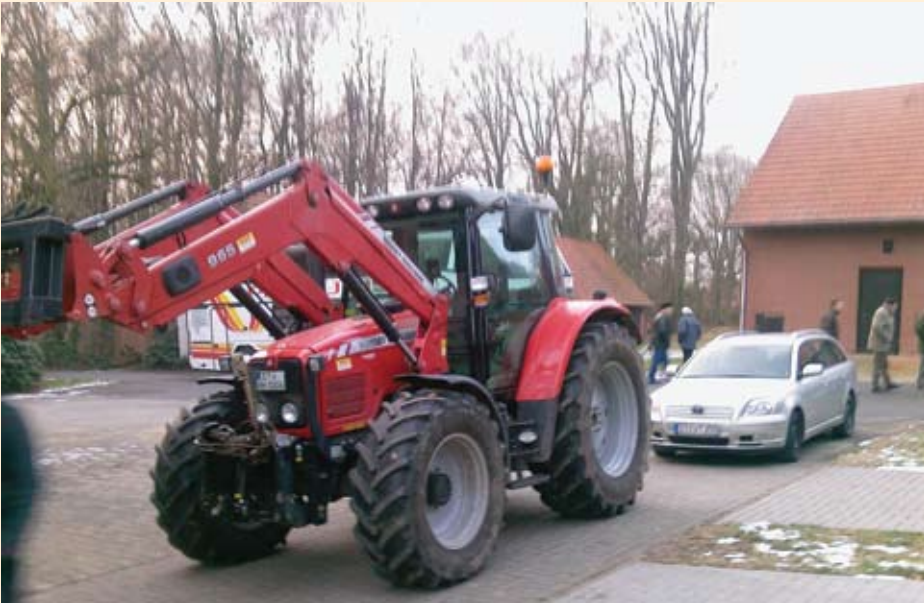
Ovaj Massey Ferguson zadužen je doslovce za sve. I za rad u štali, u šumi i na polju

na kraju uzme papir i olovku, zaradio je čistaka po biku 150 Eura. Dakle, može računati na čistih 13.500 eura po turnusu. Od države dobije godišnju potporu za čitavo gospodarstvo od 40.000 Eura. Ispričao nam je i kako kod njih funkcionira poljoprivredna savjetodavna službu. Godišnje ju plaća 350 Eura, i ona mu za uzvrat šalje literaturu i materijale. Po pozivu ga obilaze u trajanju od jedan sat mjesečno, a sve preko toga plaća dodatno. Obilaskom ovoga idiličnog imanja doista se ima osjećaj blagostanja i mirnoće. Srećemo i prikolicu za konje obzirom da je her Herman bio nekada jokey. Sve što može što se tiče energije rješava drvima, jer posjedovanjem šume ima i nekakav ipak stalni priljev drvene mase.