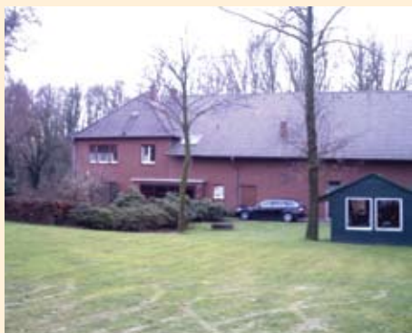
Prekrasna i idilična kuća naslonjena je na samu štalu

sebice svidjela njegova stara štala u kojoj tovi bikove. Štala je stara 250 godina, i trenutno u njoj ima 90 bikova. Nabavlja ih u Bavarskoj sa 170 kg. težine i tovi do 750 kg. Tele plaća 670 eura po komadu. Tov traje približno 15, 16 mjeseci. Na kraju za utovljenog bika dobije 3,40 eura po jednom kilogramu. Kada, kako on kaže,