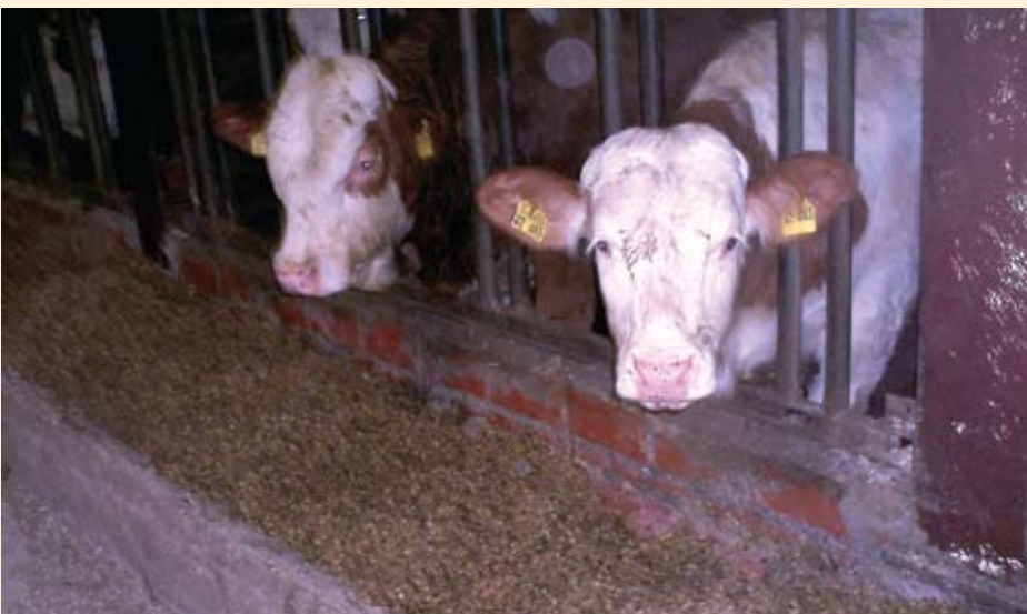
Tovi bikove simentalске pasmine