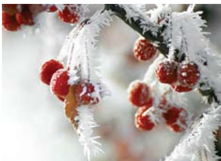
Protiv mraza uspješno štite antifrost sustavi, ali još uvijek ih je nedovoljno za pravu zaštitu

Vrijednost šumskih sastojina prije nastanka štete utvrđuje se ovisno o dobu i stadiju razvitka sastojine u skladu s Pravilnikom o uređenju šuma. Za oštećene šumske sastojine utvrđuje se vrijednost drvne mase po sortimentima (tehničko i ogrjevno drvo) obračunane s prosječnim cijenama koje su ostvarene prethodne godine.