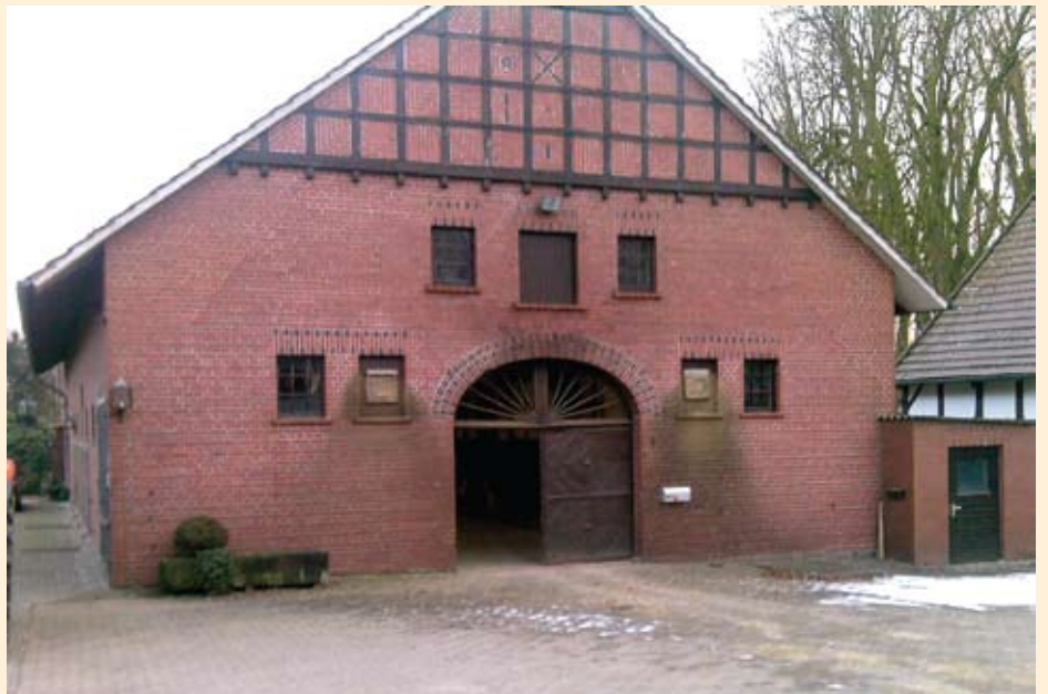
Ova je štala stara 250 godina i odlično služi svojoj svrsi