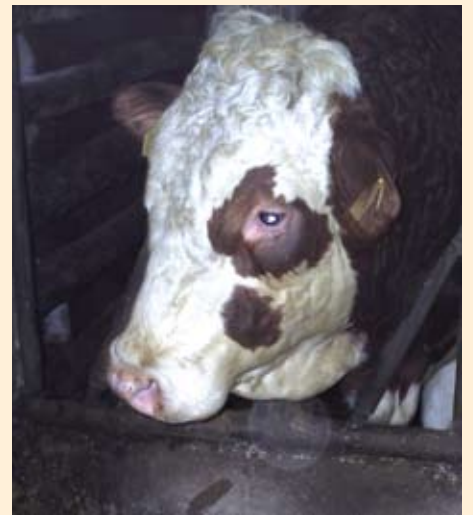
Simentalac je najčešće toвно govedo u Njemačkoj. Tovi se do starosti 15-16 mjeseci, a osnova hranidbe je silaža stabljike, zrna i klipa kukuruza