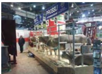
Govedarstvo je ipak bilo u prvom planu

2 mjeseca, a ujedno smanjuje rizik prenošenja nekih infekcija između teladi.