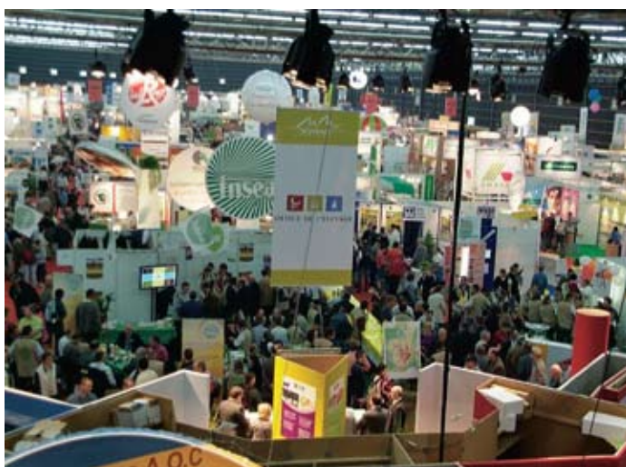
Pogled na jednu od brojnih izložbenih dvorana