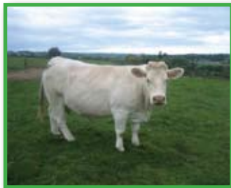
Godine 2005. u Francuskoj je poslovalo 735.000 farmi

Treće iznenađenje – kopuni hranjeni mlijekom. U zaista skromnim uvjetima, rekli bi u kokšinjcima naših baka uzgajaju se kopuni – francuski specijalitet broj 1, i to pijuci mlijeko uz manji dodatak kukuruznog brašna. O kakvom se specijalitetu radi, najbolje govori podatak da kilogram očišćenog kopuna doseže cijenu od 25 €.