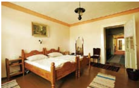
Soba u objektu obitelji Sklepić u Karancu

14. da je u apartmanu odgovarajući broj košarica za otpatke, te osiguran dnevni odvoz otpadaka.