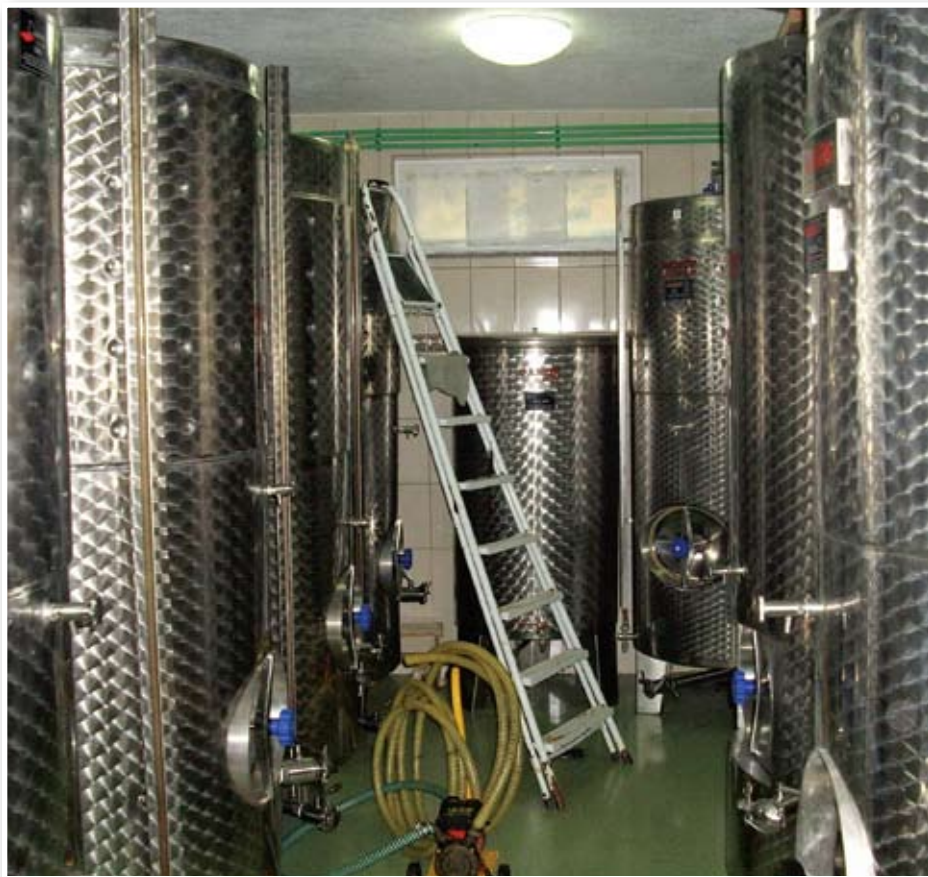
Inoks posude u podrumu obitelji Begić

Da bi se uvjerali u intenzitet radova na prenamjeni krševitog tla u obradivu površinu posjetili smo radilište tvrtke „Vinogradi