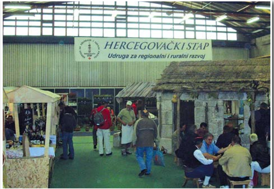
I ove godine sudjelovali su na Jesenskom Zagrebačkom Velesajmu u sklopu Eko-Etno Hrvatska

Od toga se oko 4 tisuće hektara navodnjava, s oko 180 kilometara sustava za navodnjavanje, a to je skoro polovina sustava cijele BiH. To je zasluga i naših ljudi koji su tradicionalno dobri radnici. Glavni nedostatak u agraru je nedostatak tržišta što našim poljoprivrednicima sužava prostor. Banke s ovih prostora nisu zainteresirane za plasiranje svojih sredstava u ovu oblast. Problem je u netransparentnosti podjele poticaja u ovoj oblasti, kao i veličina sredstava koja je odobrava-