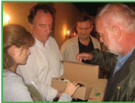
Bellonovi su goste dočekali i tradicionalnim francuskim konjakom

Sa svim ovim podacima upoznajemo se dok vijugavom cestom iz prijevoja Mont Blanc prekrivenim prvim ovogodišnjim snijegom spuštamo prema central-