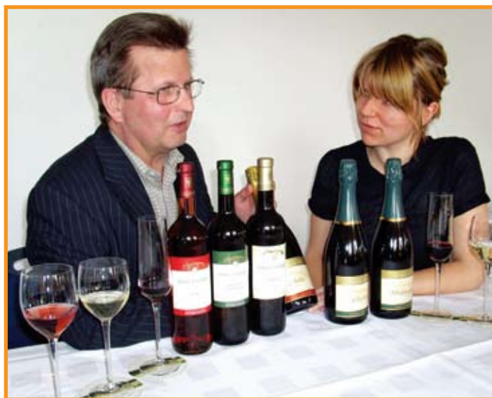
Komisije za ocjenu su na sajmovima puni posla

- Milesime Bio ima slične karakteristike kao i BioFach ali se održava u Narbonneu u Francuskoj s oko 190 izlagača. Održava se u mjesecu siječnju.