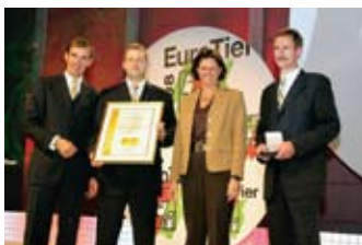
Trenutak s uručivanjem nagrade za Big dutchman

Asortiman ograda, pregrada i sličnih elemenata, koji olakša-