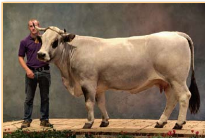
Detalj s jedne od brojnih revija

Sajam se održava svake godine i to u regiji koja je broj jedan po proizvodnji