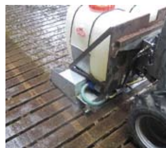
Westermanov čistač podova

2008. Na krovu se može uočiti kanal za provjetravanje, kojem je u zimskom period osnovni cilj