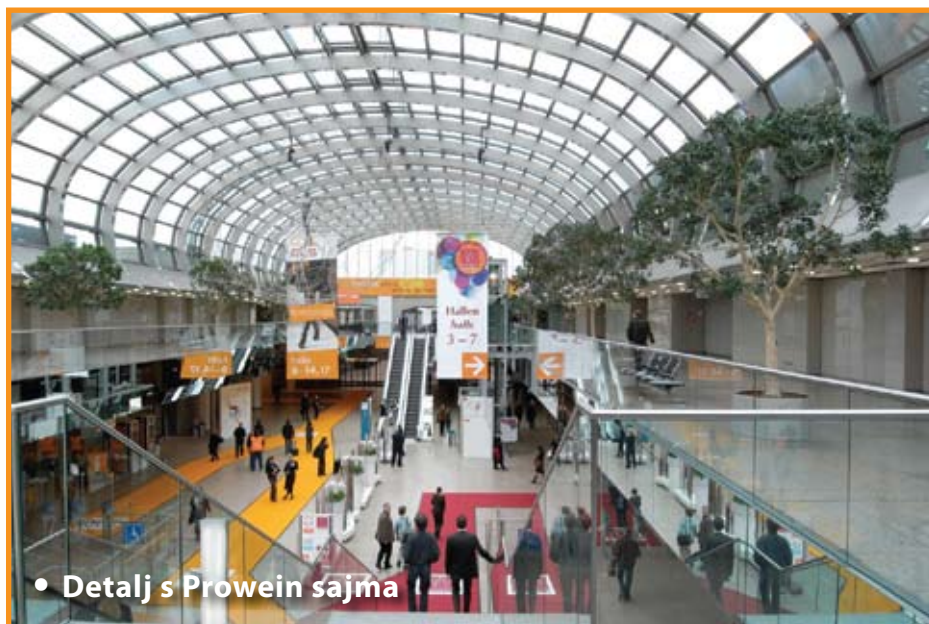
• Detalj s Prowein sajma

- BioFach je specijalizirani sajam za "Bio vina". Održava se u