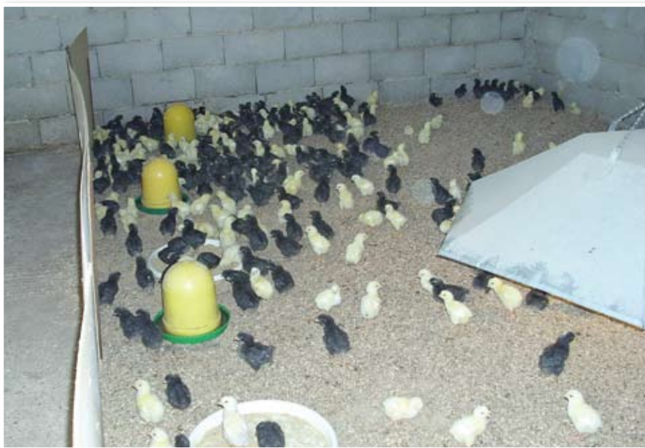
Pilići na Eko farmi Cerno