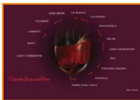
www.gruppoitalianovini.com . Com. Vinitaly se održava svake godine u Veroni

Nürnbergu i daje dobar pregled cjelokupne proizvodnje bio vina. Održava se u drugoj polovici mjeseca veljače, 2009. održat će se od 19. do 22. veljače.