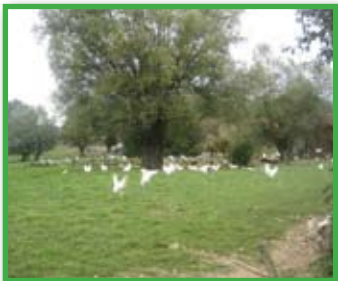
Uzgoj kokoši na otvorenom

Prvo, on posjeduje stado od 80 krava na slobodnom vezu, kod nas vrlo malo poznate pasmine montbeliarde. Stoka je u vrhunskoj kondiciji – krave su na ispaši, telad također, ali odbijena. Ta „francuska simentalka“ proizvodi do 7.500 litara visokokvalitetnog mlijeka godišnje. Mlijeko otkupljuje zadruga po cijeni od 0,40 € po litri. Drugo iznenađenje su kokoši. Naš domaćin je poznati uzgajivač kokoši na otvorenom. Te koke „iz naše mladosti“, kojih je nažalost sve manje, vidimo na našim seoskim dvorištima,