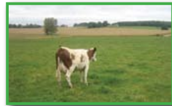
„Francuska simentalka“ proizvodi do 7.500 litara visokokvalitetnog mlijeka

Stotinjak kilometara dalje, u mjestu Charollais cijelim središtem dominira modernistička skulptura bika. Dočekuje nas predsjednik udruge proizvođača goveda i ovaca poznate pasmine charollais – kako mnogi kažu ponosa francuskog stočarstva. Vodi nas na farmu na kojoj se rodio bik iz Centra za travnjaštvo Agronomskog fakulteta. Vlasnik farme nam, uz veliko zadovoljstvo, sa svojom unučicom pokazuje svoje blago – prekrasne primjerke ove čuvene francuske