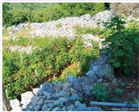
Vinograd u kamenu

- Prije toga sam se bavio uzgojem drugih poljoprivrednih kultura. Prije dvije godine sam tvrtku registrirao kao poduzeće za proizvodnju presadnica i uzgoj sezonskog cvjeca. Tijekom godine uspijem proizvesti oko pola milijuna sadnica i sve to plasiram na području Hercegovine.