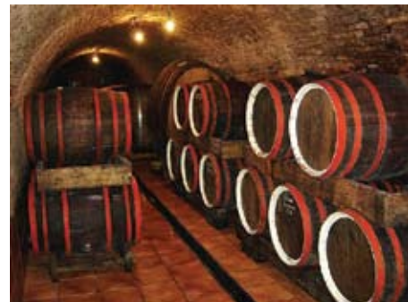
Podrum obitelji Josić u Zmajevcu

Za pružanje usluga prehrane, pića i napitaka, seljačko domaćinstvo treba imati blagovaonicu odnosno prostoriju za usluživanje gostiju, kuhinju kapaciteta koji odgovara kapacitetu blagovaonice odnosno prostoriji za usluživanje gostiju koji se izražava brojem sjedećih mjesta, ali i spremište za hranu kapaciteta kuhinje. Obavezan je i rashladni uređaj za čuvanje namirnica, pića i napitaka. Usluživanje gostiju jelom, pićem i napicima može se obavljati i u prostoru za usluživanje na otvorenom. No, zahtjevi za kuhinjom su ipak teže ispunjivi. Kuhinja treba imati termički uređaj za pripremanje jela i napu odgovarajućeg kapaciteta odzračivanja iznad termičkog uređaja ili prirodnu ventilaciju, kao i sudoper s dva korita za pranje posuđa i pribora za jelo s miješalicom