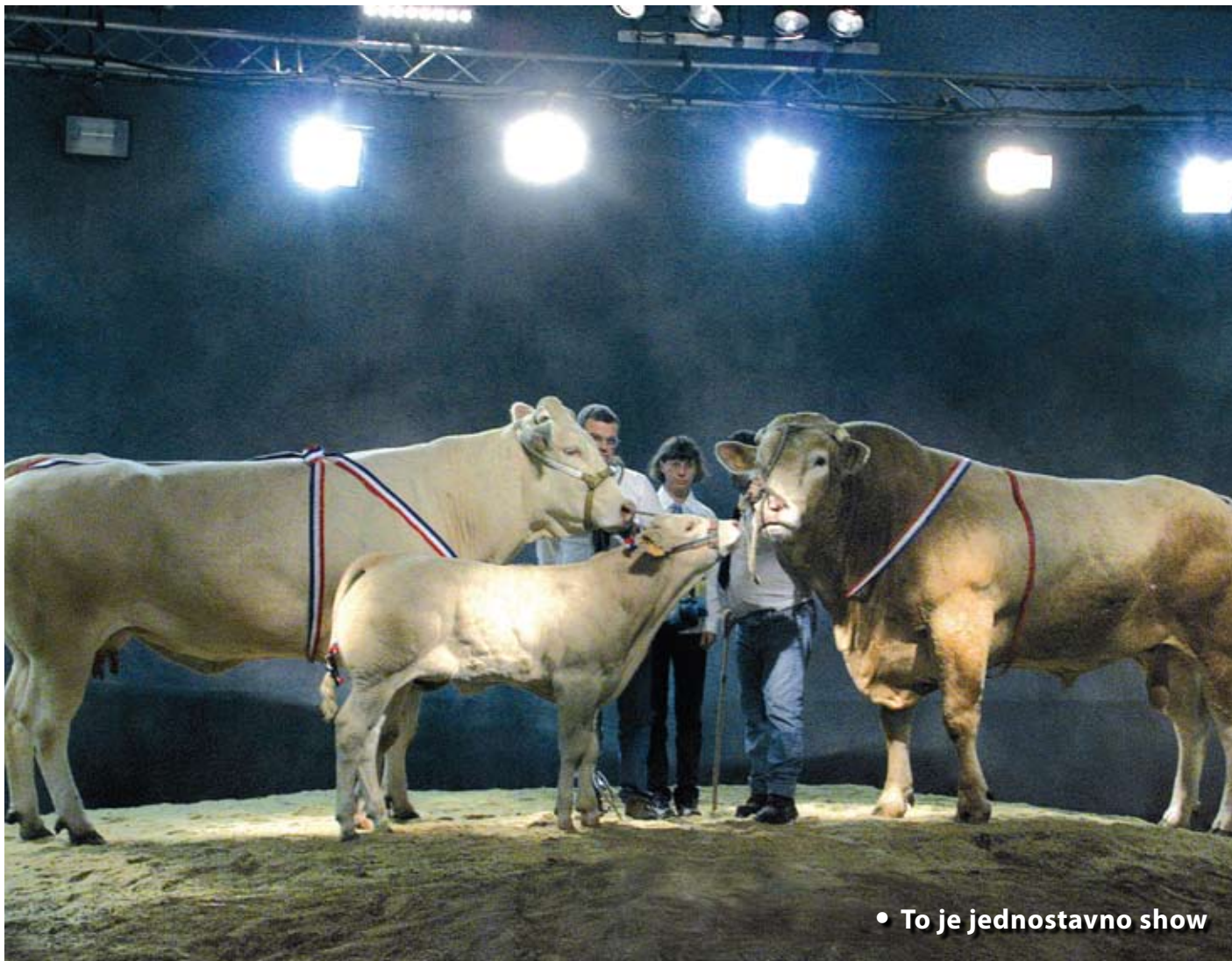
• To je jednostavno show

U svom pozivnom letku sajam „SOMMET DE L' ELEVAGE“ u Clermont Ferrandu naziva se „europskim stočarskim sajmom broj 1“. Kako smo sajam ove godine posjetili drugi put, s pravom ocjenjujemo da to nije (ne bi smio ni biti) samo marketinški slogan. Radi se zaista o velikoj manifestaciji. Po broju poslovnih susreta i obavljenim i zaključenim poslovima sajam SOMMET DE L'ELEVAGE je svakako najveći specijalizirani Europski stočni sajam (za mliječna i mesna goveda, ovce, konje, koze, svinje, perad).