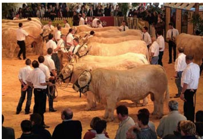
Ovo mogu samo francuzi

A: Branko ŽALAC, dipl. oec./Hrvatski poljoprivredni zadružni savez