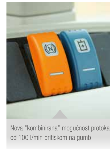
Nova "kombinirana" mogućnost protoka od 100 l/min pritiskom na gumb

Treći klipni razvodni ventil dostupan je po izboru za napajanje zahtjevnijeg dodatnog priključka.